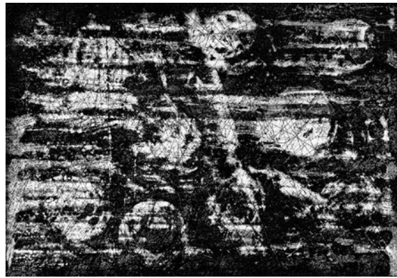
© Marco Velázquez, Sin título , 2015.

Es evidente, a partir de la información biológica y ambiental discutida, el limitado conocimiento que se tiene del ecosistema de la laguna como un todo, así como la