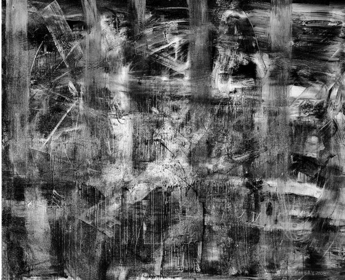
© Marco Velázquez, Sin título, 2008.

La persistencia actual de prácticas y usos inadecuados de la laguna y el riesgo inminente de daños irreversibles o pérdida del ecosistema demanda de manera urgente la aplicación de programas de manejo, restauración, protección y conservación de la laguna, con una base de conocimientos científicos actualizados.