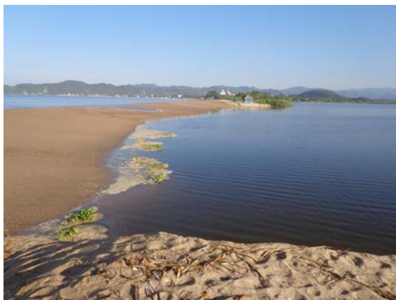
Figura 2. Parte sur de la laguna del Tule mostrando la boca de la laguna durante un periodo de comunicación con el mar (Bahía de Navidad).

Se han reportado nueve especies de aves acuáticas anidando en la laguna; Anhinga anhinga , Ardea alba , Bubulcus ibis , Butorides virescens , Gallinula galeata , Jacana spinosa , Phalacrocorax brasilianus , Porphyrio martinica y Porzana carolina (Hernández-Vázquez y cols., 2010; Hernández-Vázquez, observación personal). Sin embargo, en observaciones de campo realizadas recientemente, el número de especies y de parejas ha disminuido considerablemente como consecuencia de la contaminación y rellenos realizados en la zona de anidación.