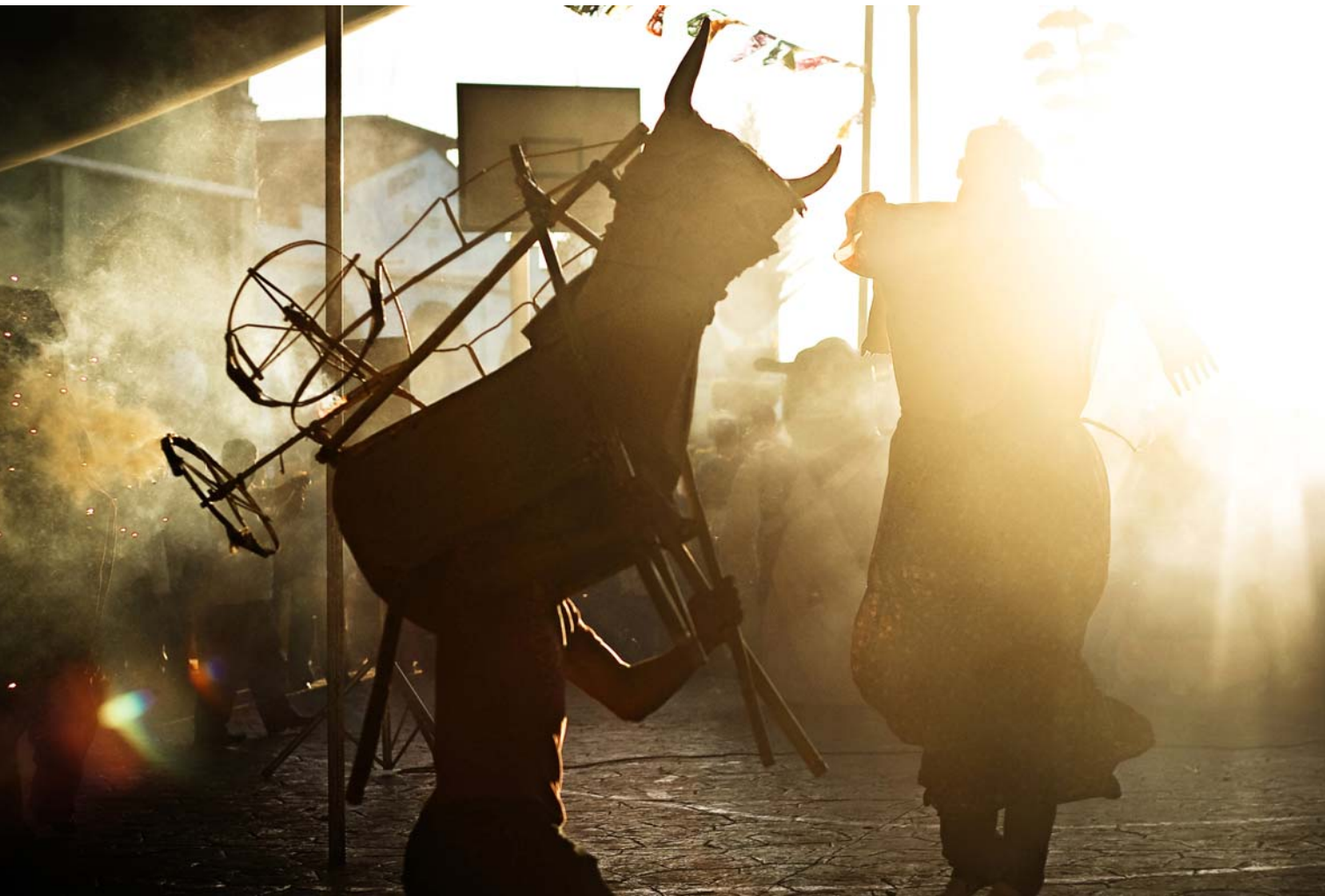
© Carlos Ordaz, El torito , México, 2011.