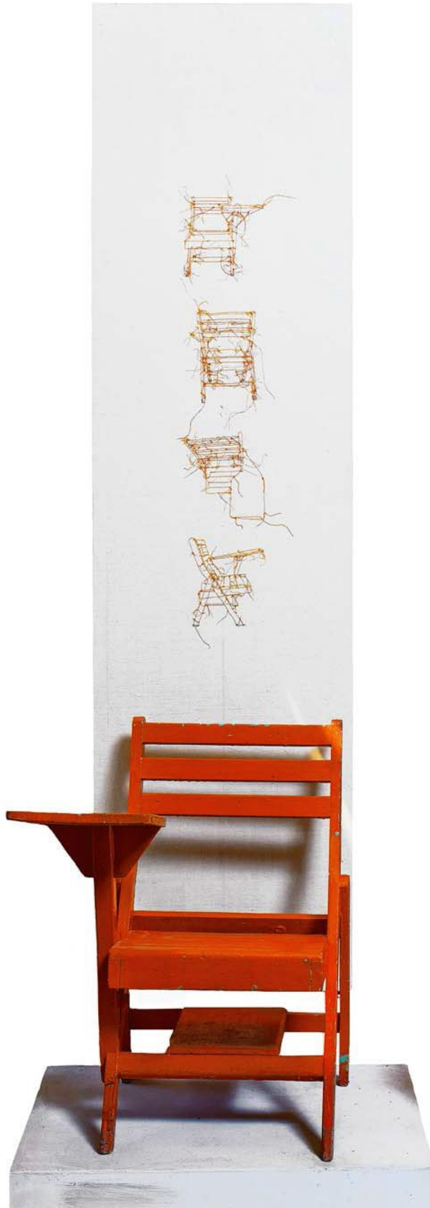
© Luz Elvira Torres, Al parecer las verdades las aprendimos al revés , obra tridimensional: madera pintada y bordado, 2005.