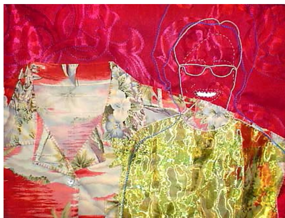
© Luz Elvira Torres, La ternura (Amor incondicional) , textil, 2008.