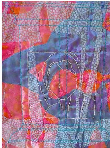
© Luz Elvira Torres, La alegría , hilo y tela sobre tela, 2008.

Julio Muñoz Departamento de Fisiología CINVESTAV jmunoz@fisio.cinvestav.mx