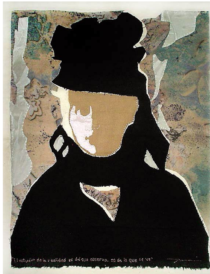
© Luz Elvira Torres, El estudio es del que observa, no de lo que se ve , textil, 2008.

Esa interrogante me dirige a un periodo de la historia médica que no conocía cuando escribí Némesis médica . Cuando uno investiga a historiadores médicos uno está investigando a personas que han escrito en los últimos 100 años. Al comienzo del siglo XX un grupo de profesores de Leipzig tuvieron la idea de decir: no es suficiente leer biografías de médicos ni investigar la historia de hospitales; la medicina como tal, como empresa, se guía por un cuerpo de ideas, por un supuesto conocimiento, y nosotros debemos estudiar eso y convertirlo en nuestro tema de investigación. La mitad de estos se volvieron