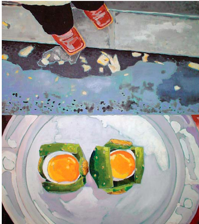
© Luz Elvira Torres, Mis bodegones , óleo sobre tela, 2004.