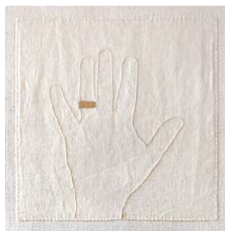
© Luz Elvira Torres, Fragilidad 1/6 , hilaza de algodón y metal sobre tela, 2003.