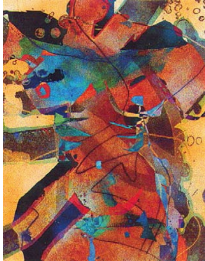
© Luz Elvira Torres, No. 1 de la serie Las gordas , gráfica digital, 1999.