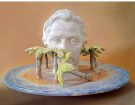
© Luz Elvira Torres, Mis vacaciones , talavera, 2006.