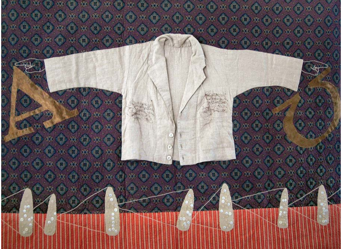
© Luz Elvira Torres, Eterno abastecimiento , textil, 2008.