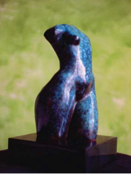
© Luz Elvira Torres, Torso femenino , bronce, 1996.