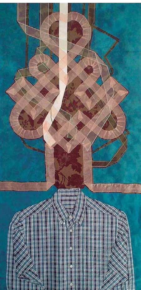
© Luz Elvira Torres, La estabilidad , textil, 2008.