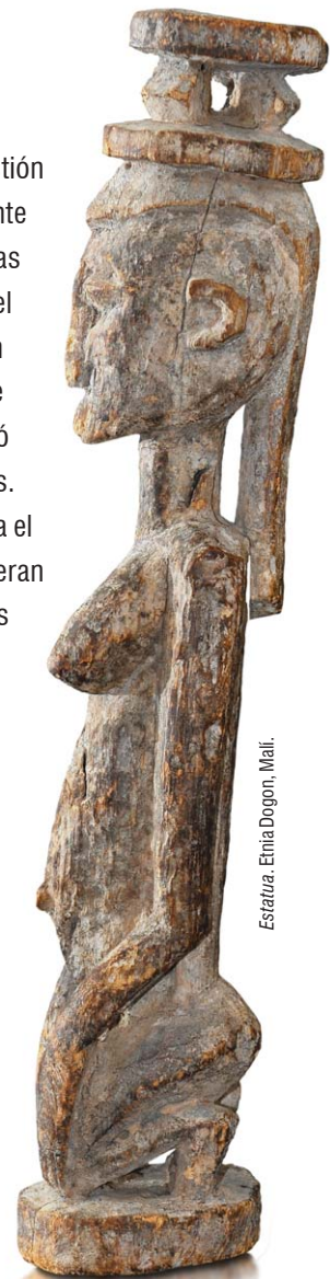
Estátua. Etnia Dogon, Mali.

Sin embargo, no existe una respuesta única y satisfactoria que dé cuenta del número exacto y total de personas que han pasado por este mundo. ¿Qué dices, te animarías a calcularlo?