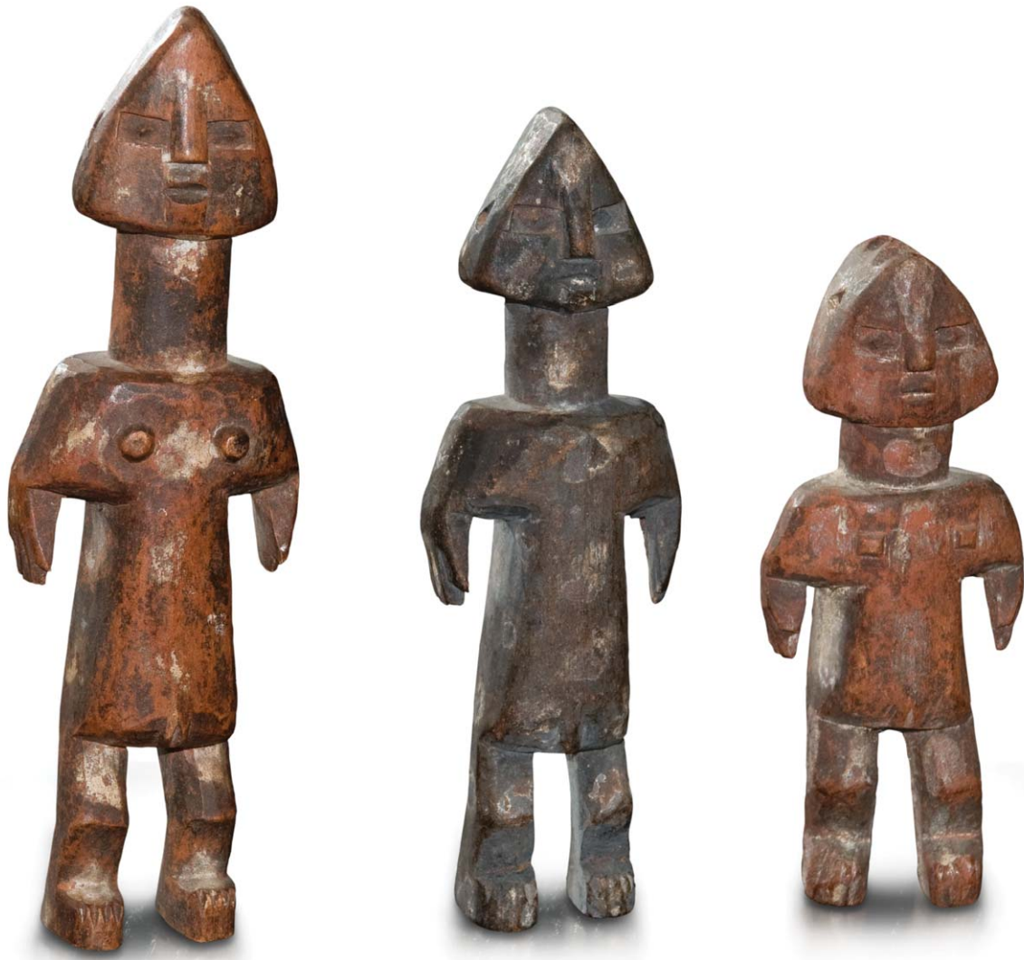
Estatuas. Etnia Ada, Adan o Gan, Togo y Ghana.