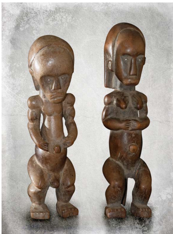
Pareja de estatuas de ancestros de Bieri, Elnia Fang, Gabón.

Sin embargo, actualmente este indicador ha disminuido notablemente. A esta situación se le ha denominado “ventana demográfica” o “ventana de oportunidades”, ya que bien aprovechada se podría lograr que el país creciera económicamente al promover el