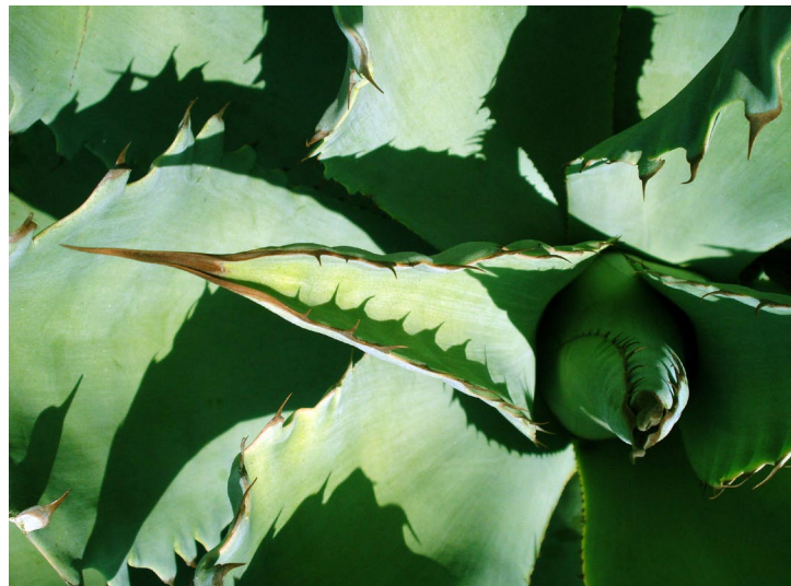
© Rosa Borrás, de la serie Maguey , 2010.

La interpretación ambiental es determinante para encausar el pensamiento de manera positiva, enfatiza los asuntos y problemas ambientales locales y globales, al destacar el valor y respeto por la naturaleza promoviendo el desarrollo sustentable, procurando la toma de conciencia que destaque la importancia de respetar y conservar la biodiversidad vegetal y animal, los recursos naturales y en general el medio ambiente. Es una propuesta de apoyo al sistema educativo en su nivel básico para concienciar comportamientos de responsabilidad ética.