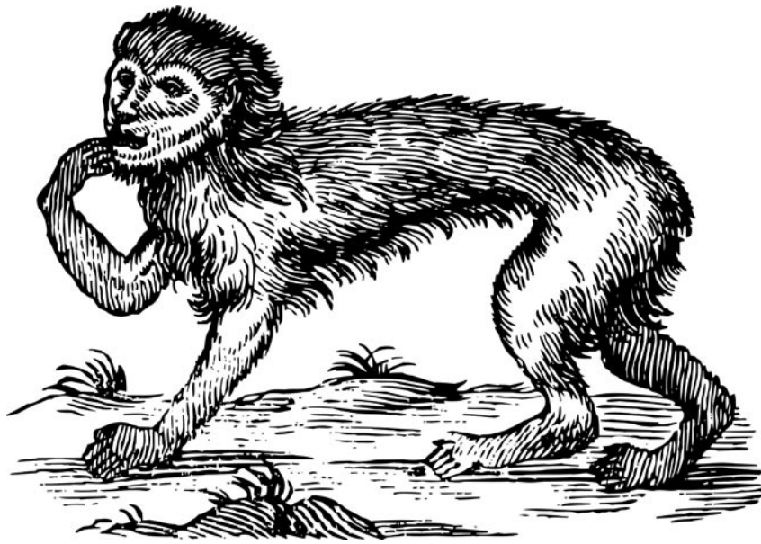
Mono. (Tomado de Gómez de Liaño I. Athanasius Kircher. Itinerario del éxtasis o las imágenes de un saber universal , Ediciones Siruela, Madrid, (2001) 73.)

Debo decir que a primera vista este libro me causó cierto interés y es que de igual forma debo admitir que la promesa de “y otros cuentos” es muy tentadora para una persona que disfruta de lo inesperado. Sin embargo, su lectura me resultó un tanto frustrante, pues en su afán por documentar los hechos con todos los detalles a su alcance, la autora sacrifica la posibilidad de una lectura directa, dejando apenas entre líneas el que –intuyo– podría haber sido el leitmotiv de esta obra: el hecho de que las criaturas incubadas en nuestra imaginación y alimentadas por nuestro temor y nuestra ignorancia no resisten la embestida del análisis racional