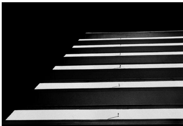
de la serie Arquiografías, 2001-2002.

En una cultura oral primaria la restricción de la palabra al sonido determina no sólo los modos de expresión, sino también los procesos de pensamiento y, además, como diría Walter J. Ong, “uno sabe aquello que puede