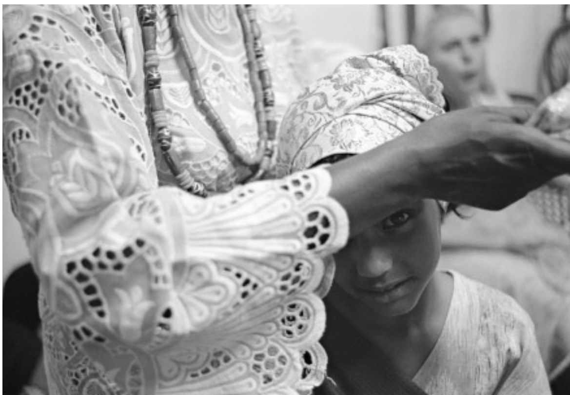
Fiesta de las Orixás, Sao Paulo, Brasil, 1998.

ron códices que atesoraron esa memoria pero la tradición del tlacuilo que pintó el Códice Vaticano A no los conoció, es solo uno de los muchos aspectos de la historia antigua y del lugar que Cholula ocupó en el universo mítico mesoamericano que permanecen todavía en el misterio.