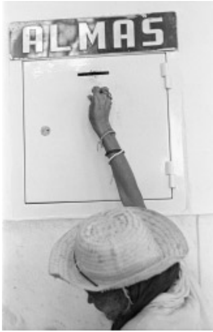
© Adriana Zehbrauskas, Juazeiro do Norte, Brasil, 1998.

(1735-1802), de el padre José Antonio Pichardo (1748?-1875) y de Veytia. Alexander von Humboldt adquirió, en 1802, de los herederos de León y Gama, algunos, incluyendo el llamado Códice Boturini o Tira de Peregrinación, y los entregó a la Biblioteca Nacional de Berlín donde permanecen hasta hoy. Lord Edward Kinsborough (1795-1837) incluyó facsimilares de estos documentos en su magna obra, Antiquities of México , en 1826. La colección de documentos de Boturini se encuentra hoy distribuida entre la Biblioteca Nacional de Berlín, como colección Aubin-Goupil en la Biblioteca Nacional de París, y 42 manuscritos en el Museo Nacional de Antropología, el Archivo Histórico del INAH y en la Biblioteca Nacional de México. En 1768, Veytia se integró a la orden de los Agustinos. Su Historia antigua de México (México, 1836) se publicó en tres volúmenes y, póstumamente, la Historia de la fundación de la ciudad de Puebla de los Ángeles en la Nueva España , en 1931.