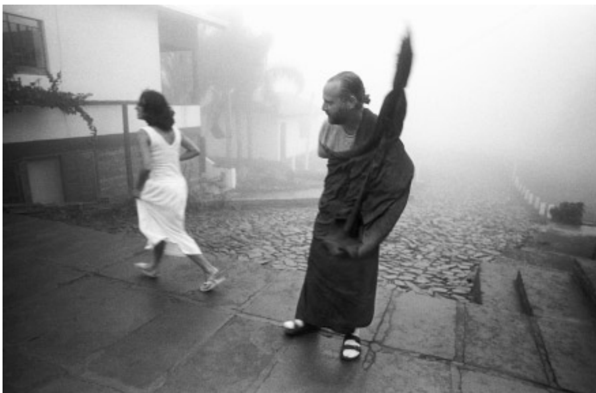
templo Budista-Tibetano Khadro Ling, Três Coroas, Brasil, 1999.