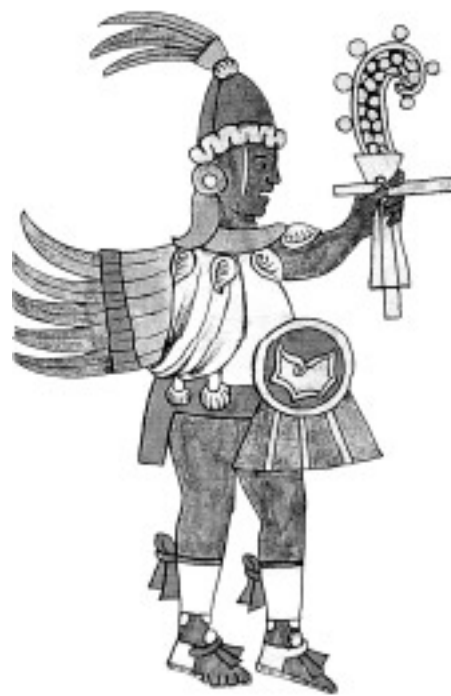
Quetzalcóatl, Códice Florentino, sumario f. 10 v.

Las fuentes originales de esta versión de los gigantes en la fundación de Cholula, de Veytia, Kingsborough, y así de D.H. Xochitiotztin y finalmente del Ayuntamiento cholulteca en el trienio de 1993-1996, entonces, podemos remitirlas a los códices y documentos mexicanos de la colección de