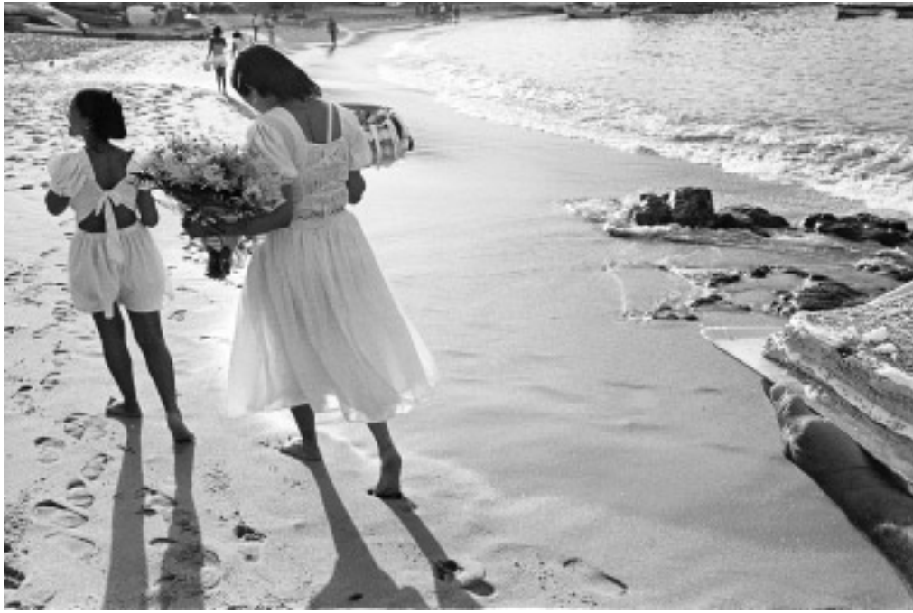
© Adriana Zehbrauskas, Día de Iemanjá, Salvador, Brasil, 1999.