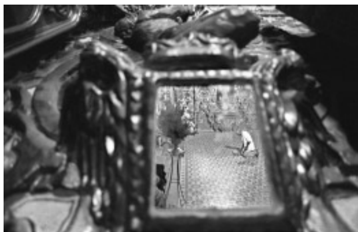
© Adriana Zehbrauskas, Oaxaca, México, 1997.

ria del alto desarrollo humano y cultural alcanzado en el valle poblano tlaxcalteca con anterioridad. 21