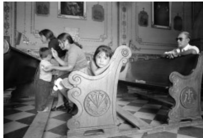
© Adriana Zehbrauskas, Oaxaca, México, 1997.

deformación craneal, que fue encontrado en su interior, 25 demuestra la influencia de prácticas mortuorias de las culturas olmeca del Golfo y del sureste de México aunque, también, por los adosamientos posteriores, de la relación que Cholula tendrá, a partir de entonces, con las culturas de la cuenca del Valle de México, es decir, Teotihuacan. El alto desarrollo cultural de las culturas del valle poblano tlaxcalteca, sin embargo, dejó sus huellas en la Conejera: justo antes del adosamiento (entre 200-350 a.C.) de tableros que la asemeja y la distingue de monumentos teotihuacanos, hay indicios de que este templo fue abandonado y sellado con tierra. Se trata del aporte cultural de una historia antigua, exhibida por la clara separación entre los vestigios preclásicos de los primeros pobladores de Cholula y los adosamientos teotihuacanos posteriores, que indican el alto desarrollo independiente de las culturas del valle poblano tlaxcalteca y de Cholula, a los cuales nos referimos escasamente. 26