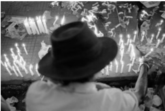
© Adriana Zehbrauskas, Juazeiro do Norte, Brasil, 1998.

del altiplano subordinadas a su enorme poderío, entre 200-800 d.C., cuando se convirtió en la gran urbe comercial, la ciudad sagrada comercial, como la llamó Paul Kirchhoff. 28 La investigación arqueológica y la clasificación de su cerámica dio cuenta del intenso comercio mesoamericano que se organizó desde la ciudad: mercancías traídas del más remoto sureste y sur de Mesoamérica, desde las costas del Golfo, desde y hacia el noroeste, llegan a Teotihuacan y a otras ciudades desde Cholula. La afluencia y la intensificación de los contactos con los pueblos de la costa del Golfo y la Huasteca son también notables a lo largo de este periodo y tendrán, presumiblemente, importancia en la adopción, en el