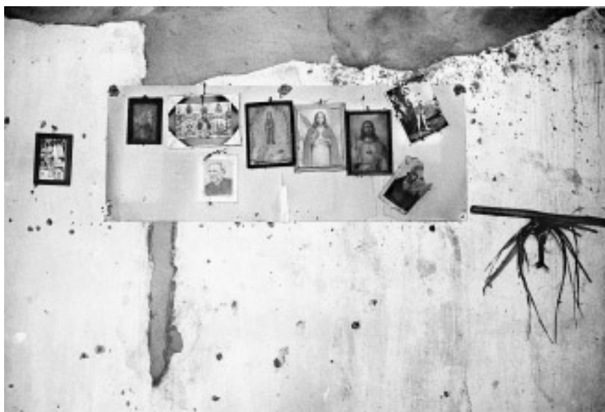
© Adriana Zehbrauskas, Sertão do Cariri, Brasil, 1996.

Quizás porque está estructurado y tiene una estrecha relación con los ciclos agrícolas, su función sagrada y de cohesión o identidad cultural perduró incluso entre tradiciones actuales de culturas indígenas de México. 13 Sin embargo, cada grupo cultural, en este proceso de integrar sistemas ideológicos heterogéneos de larga duración histórica, a lo largo y ancho del territorio mesoamericano, debió introducir sus aportaciones específicas al mito cosmogónico. La alusión a Cholula en varias fuentes tempranas demuestra no solo que los cholultecas están entre los primeros pueblos mesoamericanos, sino también habla de su centralidad en los relatos fundacionales de las culturas del altiplano. La historia antigua de Cholula, como lo demuestra y lo deforma el Códice Ríos, pertenece (en palabras compuestas entre Miguel León Portilla y Alfredo López Austin) a “la trama y la urdimbre [...] de los relatos fundacionales que constituyen con cierta homogeneidad subyacente [...] ‘el texto’ primordial de Mesoamérica”. 14