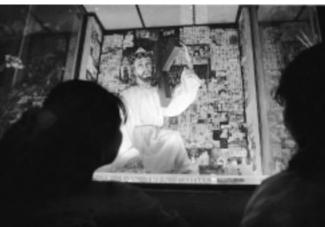
© Adriana Zehbrauskas, Oaxaca, México, 1997.

De manera importante la explotación del maguey y del quiote se multiplicó en el valle: se han descubierto hornos construidos de manera central en los pueblos, al grado de