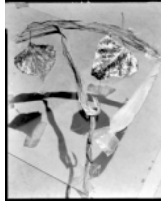
de la serie La vida secreta de los objetos, 1996-1999.

3) El top ten es caprichoso. Yo sospechaba que El naufragio de la Medusa o el Chopin por Delacroix (presente su reproducción en todas las academias de piano hasta hace veinte años) formarían parte de los cuadros más visitados. No es así, y no tengo explicación. Pero el mayor capricho es, por supuesto, el que se refiere a Leonardo da Vinci. Si un marciano por fin se presentara en nuestro planeta, e hiciera una valoración de Leonardo a partir de lo visto en el Louvre una tarde de domingo, resultaría imposible que lo imaginara matemático, cocinero, inventor y músico, además de pintor de señoras. Queda claro, en el Louvre, que Leonardo el pintor no forma parte del top ten sino sólo una de sus creaciones: la Gioconda . En el largo y sinuoso