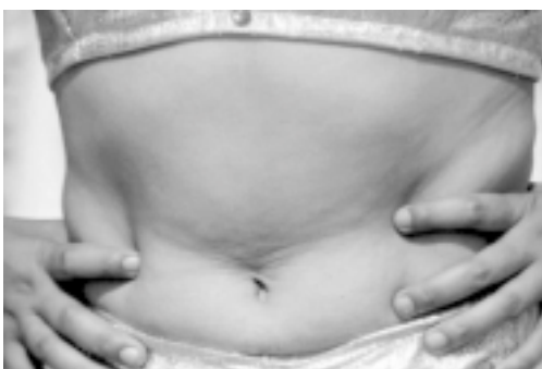
de la serie El retrato del cuerpo, 1999-2001.

diferencia esencial entre 'yo' y un demostrativo usual: puede haber una falla de referencia al usar 'esto' (piénsese, por ejemplo, en el caso de una sombra a la que señalo creyendo que es una persona o un espantapájaros y que no es ninguna de las dos cosas), pero no la podría haber al usar 'yo', porque el sujeto que usa 'yo' al aseverar algo no tiene que buscar aquello que dice 'yo'; el enunciante es el pensante. De manera que, independientemente de que se considerara a 'yo' como un nombre o como un demostrativo, de todos modos existiría la necesidad de una "concepción" por medio de la cual 'yo' se fijara a su objeto. En el caso del cogito cartesiano, e.g., el pensar del pensamiento-yo sería lo que asegura esta garantía contra una referencia equivocada. Anscombe concluye, después de rebatir al lógico que no puede demostrar la "referencia-garantizada" de 'yo' y después de demostrar que "este cuerpo" no puede ser ese referente garantizado, que si 'yo' es una expresión referencial, entonces Descartes tenía razón al entender ese referente como el Ego o Res cogitans . Veamos por qué.