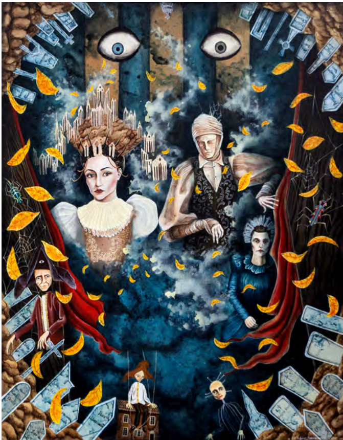
© Rodrigo Orozco . Los homenajeadores (póster oficial del cortometraje), técnica mixta/madera.