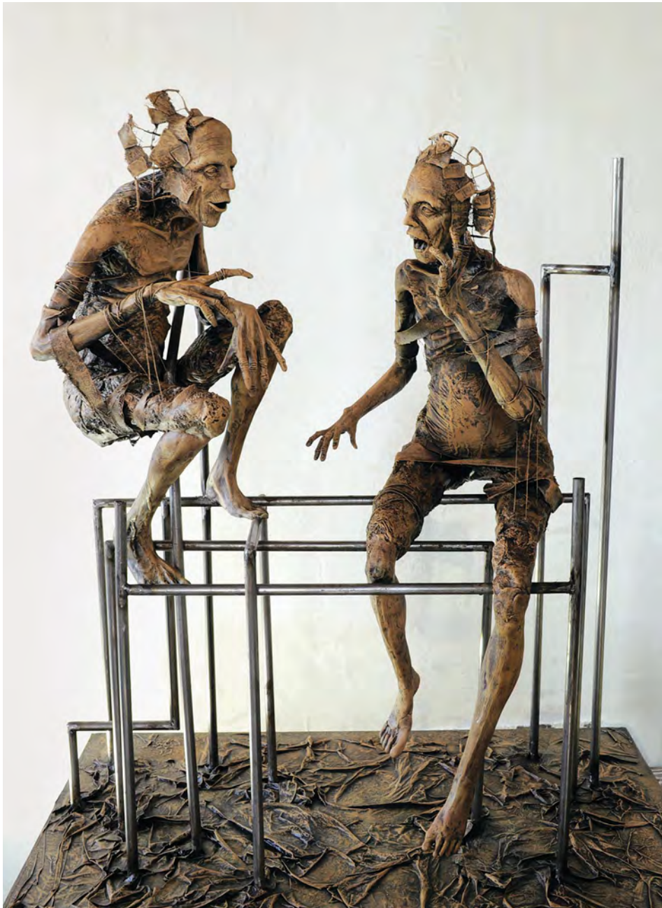
Preludios , escultura en resina y aluminio, 50 x 80x 93 cm.