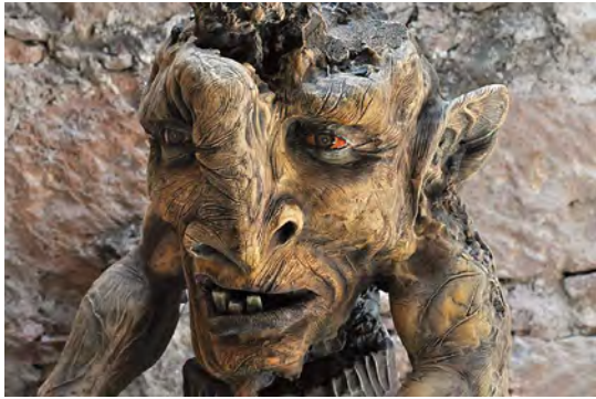
© Rodrigo Orozco . Troll , personaje del cortometraje "La hora de los sueños".