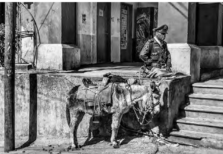
© Enrique Soto. Tetela, Morelos, 2013.