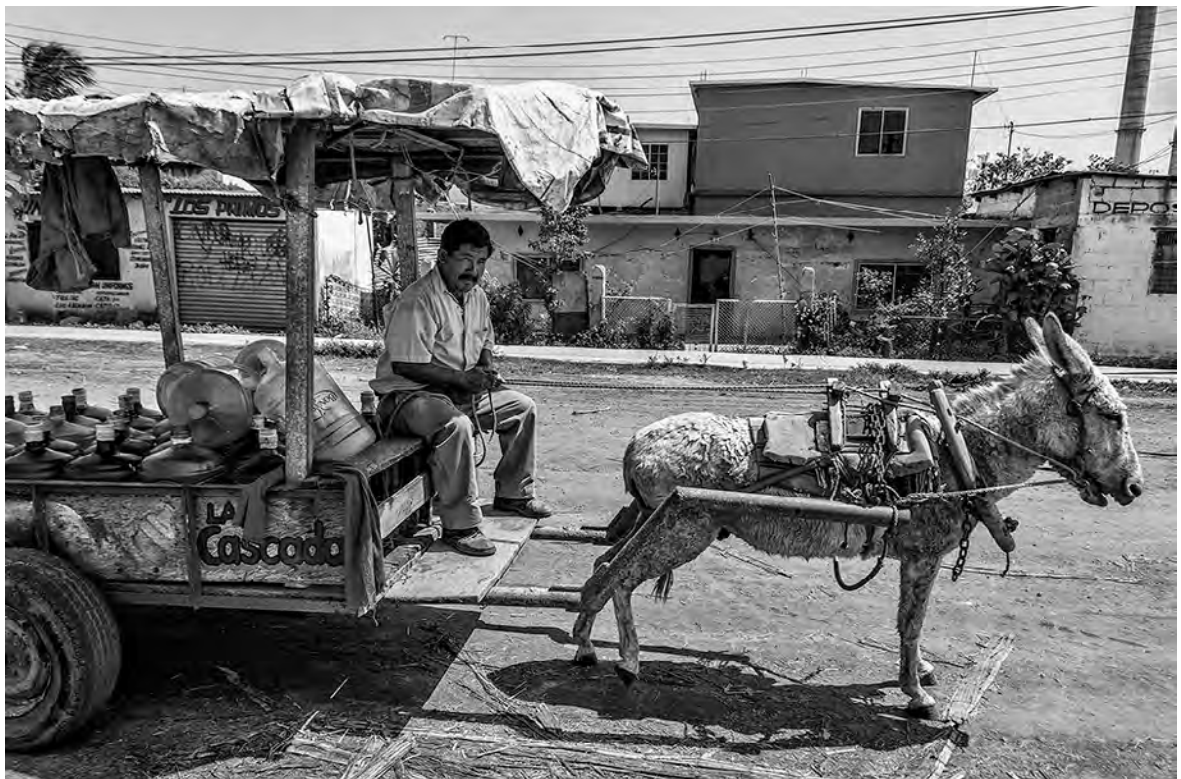
© Enrique Soto. Cosamaloapan, Veracruz, 2013.