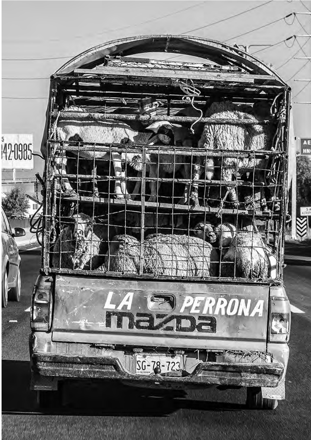
Autopista México-Puebla, 2009.