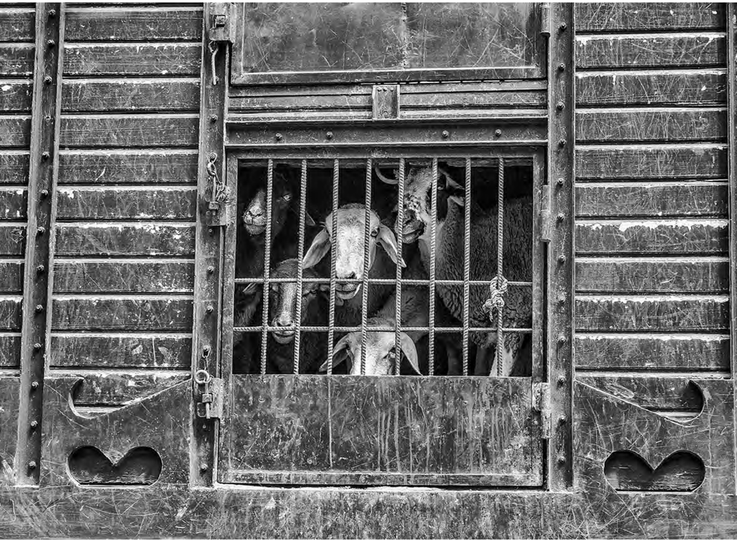
Taddert, Marruecos, 2010.