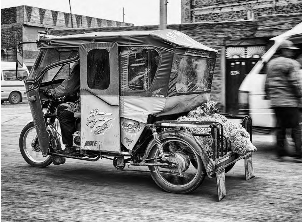
© Enrique Soto. Puno, Perú, 2008.

sabe que las regiones tropicales tienen una mayor riqueza y diversidad vegetal que se ve reflejada en la composición de semillas removida por esta hormiga. Este hallazgo corrobora la idea de que la región tropical ofrece una mayor diversidad de recursos para las hormigas.