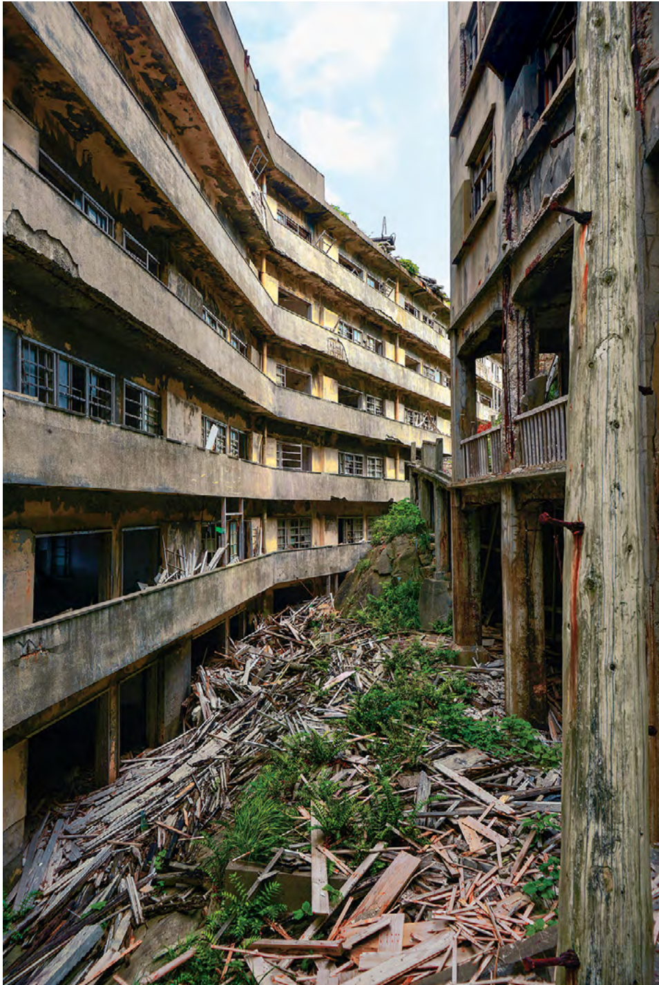
De la serie Ciudades Muertas, 2010-2014.