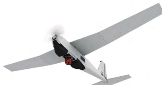
Figura 2. Avión no tripulado con capacidad para el monitoreo de fugas de hidrocarburos en ductos. 2

Se debe seleccionar el UAV adecuado para colocar una cámara infrarroja antes de realizar la inspección en las instalaciones de hidrocarburos para la localización de fugas. Si las instalaciones son de pequeña extensión como refinerías o estaciones de bombeo, se recomiendan los UAVs multirrotor que pueden ser controlados en espacios reducidos. En cambio, si la instalación es de grandes dimensiones como las tuberías de distribución de hidrocarburos, se recomiendan los UAVs tipo planeador debido a su menor consumo de energía y mayor capacidad para recorrer grandes distancias.