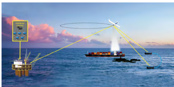
Figura 3. Esquema de un sistema de detección de fugas de hidrocarburos en instalaciones petroleras.

Actualmente, AeroVironment 3 ofrece UAVs para sistemas de monitoreo de instalaciones industriales, tuberías de transporte de combustibles y zonas con incendios forestales (Figura 3). Estos sistemas son más económicos, consumen menos energía y pueden ser enviados a lugares de difícil acceso en comparación con sistemas tradicionales de monitoreo (aviones ligeros o helicópteros).