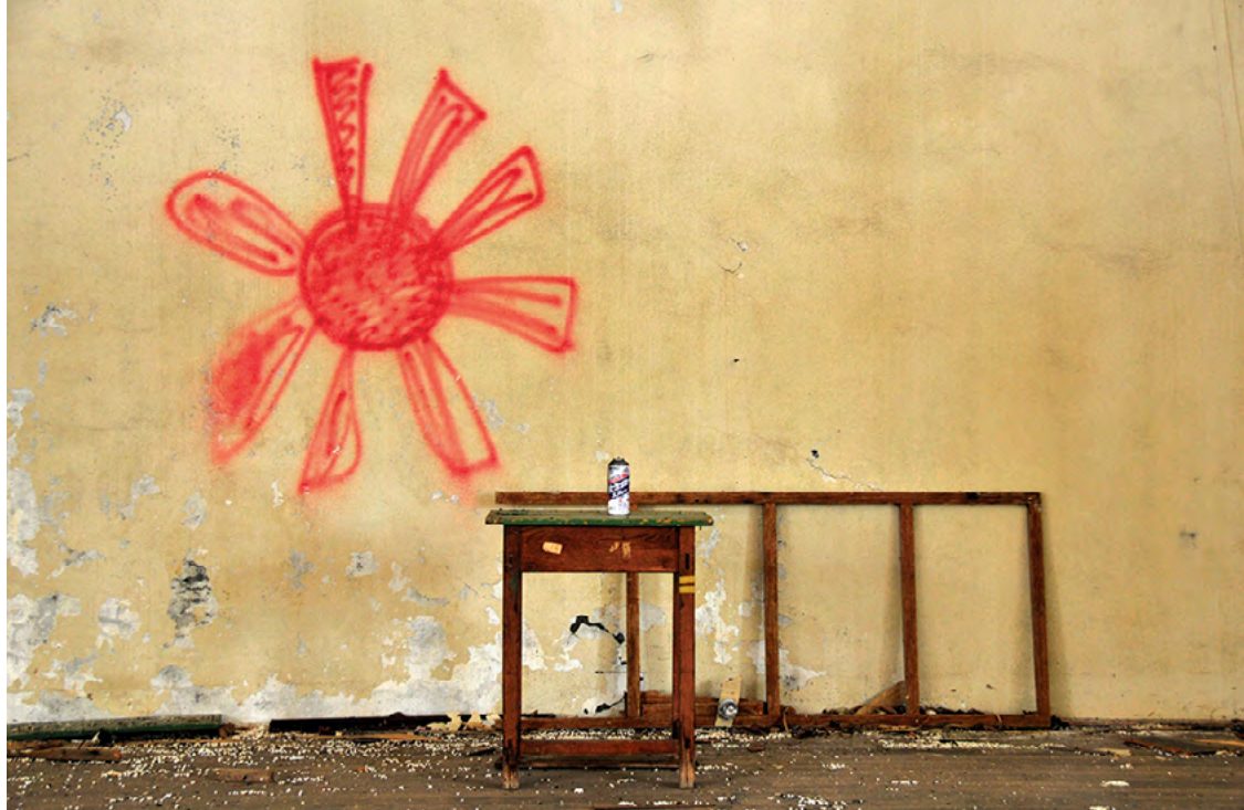
De la serie Ciudades Muertas, 2010-2014.

desertificados tienen suelos erosionados con bajo contenido de nutrientes y materia orgánica, así como baja disponibilidad de agua, por lo que su vegetación es escasa o inexistente. Debido a estas características, las plantas con endófitos pueden ser una buena opción para restaurar estos sitios. Las plantas con endófitos capaces de fijar nitrógeno pueden sembrarse en sitios pobres en nutrientes. Además, los esquejes de algunas plantas pueden ser inoculados con endófitos para estimular la formación de raíces y, posteriormente, ser introducidos en sitios desertificados. Por lo tanto, las plantas con endófitos pueden incrementar la vegetación de los sitios desertificados, contribuyendo así a proteger el suelo y disminuir su erosión.