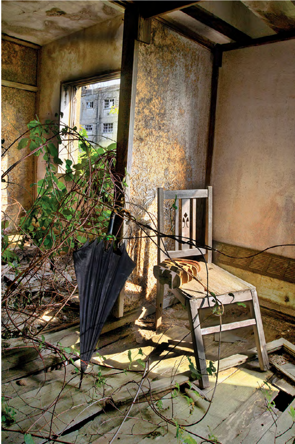
De la serie Ciudades Muertas, 2010-2014.