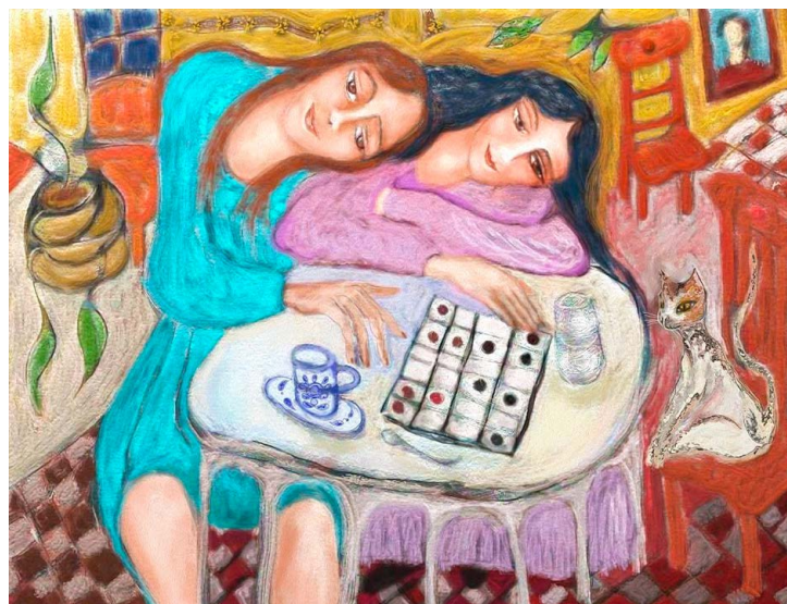
© Malú Méndez Lavielle. Damas inglesas.

La biotecnología moderna abre nuevas rutas para superar estas limitantes: desde la creación de bioformulados más estables, en presentaciones tipo polvo o gel, hasta la identificación y selección de cepas nativas con mayor tolerancia a la desecación y adaptadas a los suelos mexicanos. Estas innovaciones marcan el camino hacia un biocontrol más eficiente, accesible y ambientalmente responsable, consolidando el papel de los NEP como actores clave en la agricultura del futuro.