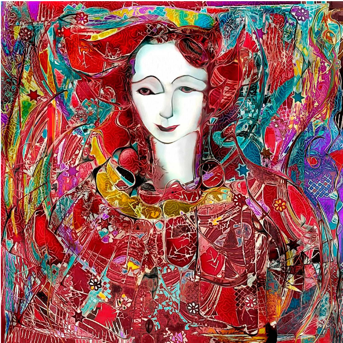
© Malú Méndez Lavielle. Arlequina .

en-baja-california-sur-para-beneficiar-hasta-200-mil-hogares . Consultado el 27 de octubre de 2025.