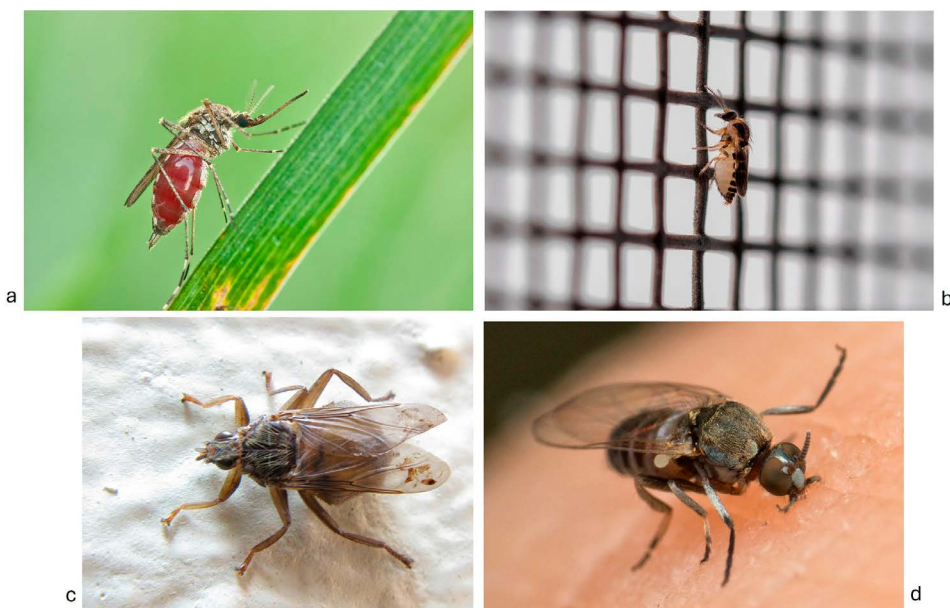
Figura 1. Mosquito hembra de la familia Culicidae. Fotografía de Mathias Krumbholz (CC BY-SA 3.0); (b) Chaquiste de la familia Ceratopogonidae. Fotografía de Asar Кадиров (CC BY 4.0); (c) Mosca de la familia Hippoboscidae. Fotografía de JonRichfield (CC BY-SA 3.0); (d) Jején de la familia Simuliidae. Fotografía de Jesse Rorabaugh (CC0 1.0).

2020). En este escrito exploraremos qué es el Plasmodium aviar, cómo afecta a las aves y qué medidas podemos tomar para mitigar este problema de salud.