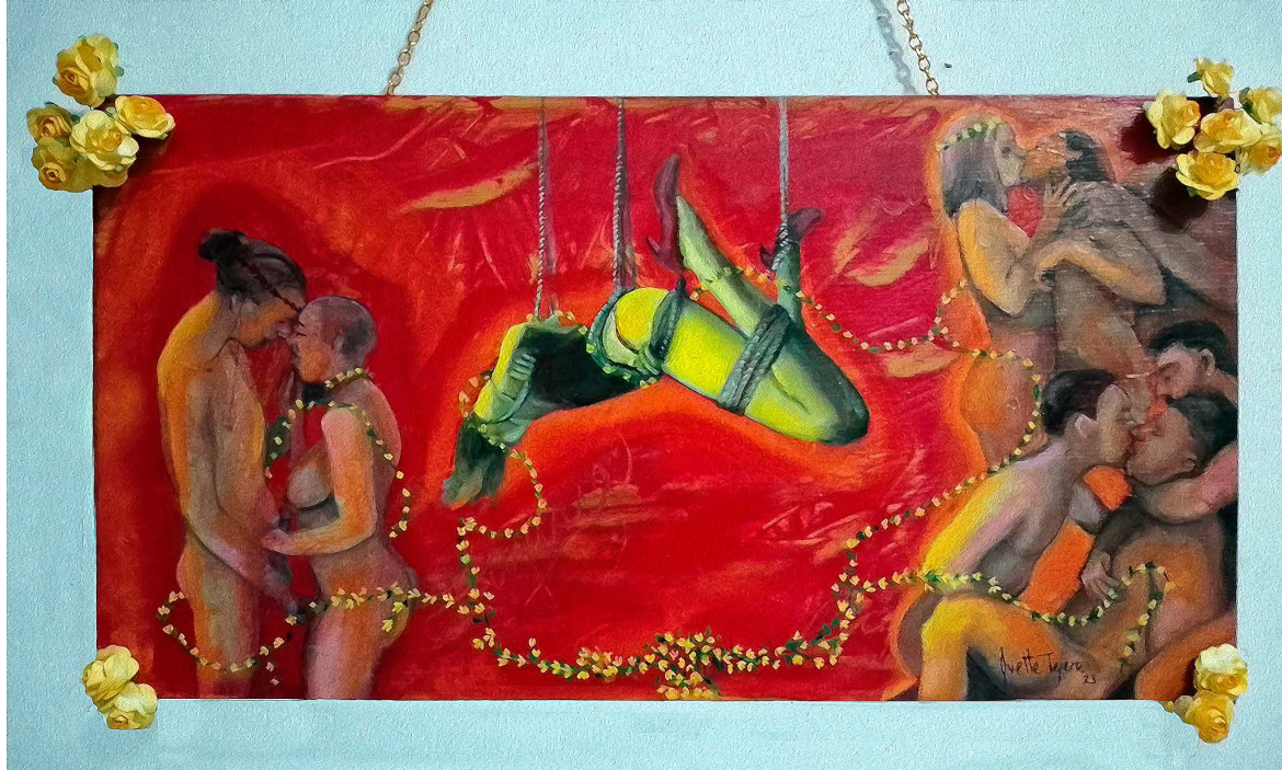
© Ivette Tejero. Lujuria Contemporánea . De la Serie Pecados Capitales. Óleo/madera, 25 x 70 cm, 2023.