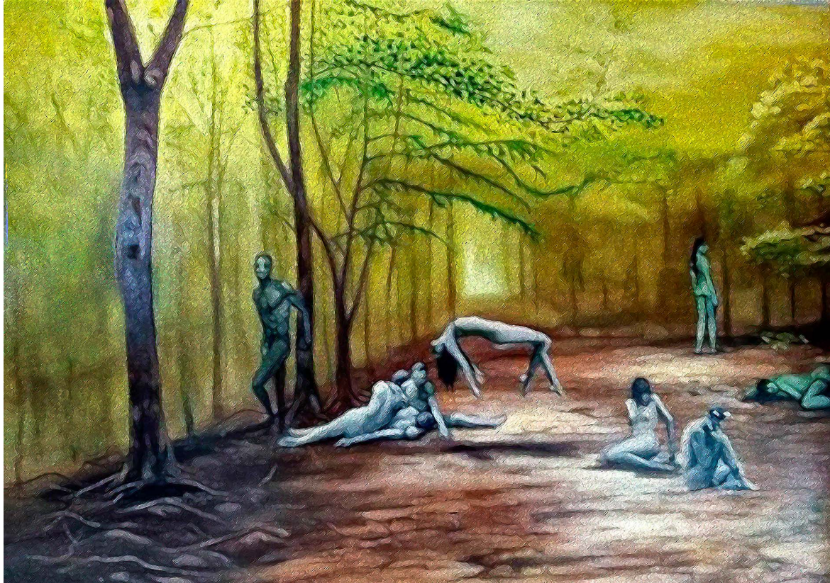
© Ivette Tejero. Ninfas y Sátiros Contemporáneos en el Edén . Óleo/madera y tela, 120 x 185 cm, 2018.

elevan los costos de los insumos y amenazan la soberanía de pequeños agricultores. Además, persiste un debate sobre los posibles efectos a largo plazo en la salud y el medio ambiente, aunque la evidencia científica disponible respalda mayoritariamente su seguridad alimentaria. En resumen, el maíz GM es una herramienta tecnológica cuya implementación requiere considerar aspectos tanto biotecnológicos como socioeconómicos.