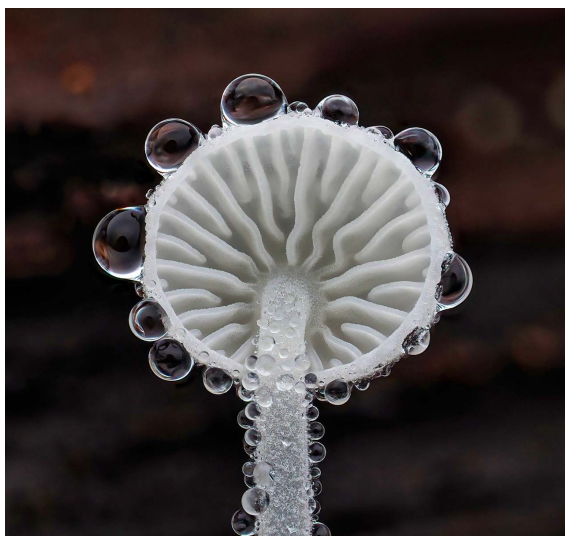
Figura 5. Hemimycena tortuosa de California, EUA. Fotografía: © Alan Rockefeller.