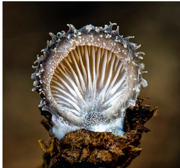
Figura 3. Hohenbuehelia mastrucata de Michigan, EUA.