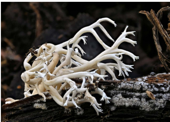
Figura 2. Lentaria sp. de Arizona, EUA.