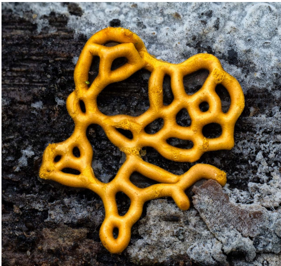
Figura 1. Hemitrichia serpula de Cundinamarca, Colombia.