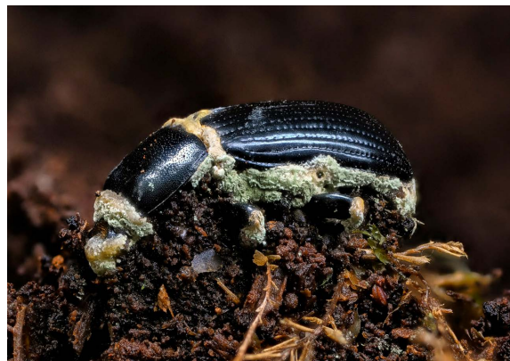
Figura 4. Metarhizium sp. de Veracruz, México, parasitando un insecto.

especies conocidas de hongos es considerablemente bajo, debido en parte a que la micología (rama de la biología que estudia los hongos) ha recibido menor apoyo y atención en comparación con otras áreas de la ciencia.