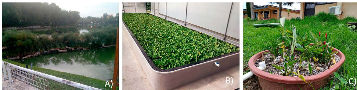
Figura 2. Ejemplos de humedales artificiales en operación, A) humedal a base de plantas de papiro ( Cyperus papyrus ) y pontederia ( Pontederia L. ) para tratar agua del “paseo los lagos” en la ciudad de Xalapa, B) humedal a base de planta lechuguilla acuática ( Pistia stratiotes ) para tratar agua del río sordo en el Instituto de Ecología, AC, ciudad de Xalapa, C) humedal a base de plantas de alcatraz ( Zantedeschia aethiopica ) para tratar agua doméstica en el Instituto Tecnológico Superior de Libres, en ciudad de Libres, Puebla.

Sin embargo, también enfrentan desafíos importantes. Requieren mayor espacio para tratar grandes volúmenes de agua, y su eficiencia puede verse limitada en climas fríos donde el crecimiento vegetal es lento. Aunado a ello, existe una regulación limitada sobre este tipo de sistemas, lo que dificulta su aceptación como alternativas o complementos a las plantas de tratamiento convencionales.