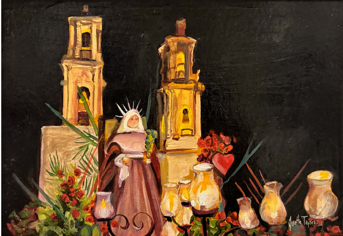
Lunes de Dolores en Taxco, Guerrero.

estar concentrada en ámbitos académicos. Es necesario popularizar y divulgar las ventajas de esta tecnología porque, como se ha visto, la mayor limitante que enfrenta es su limitada visibilidad por actores con capacidad de decisión en ámbitos de gobierno.