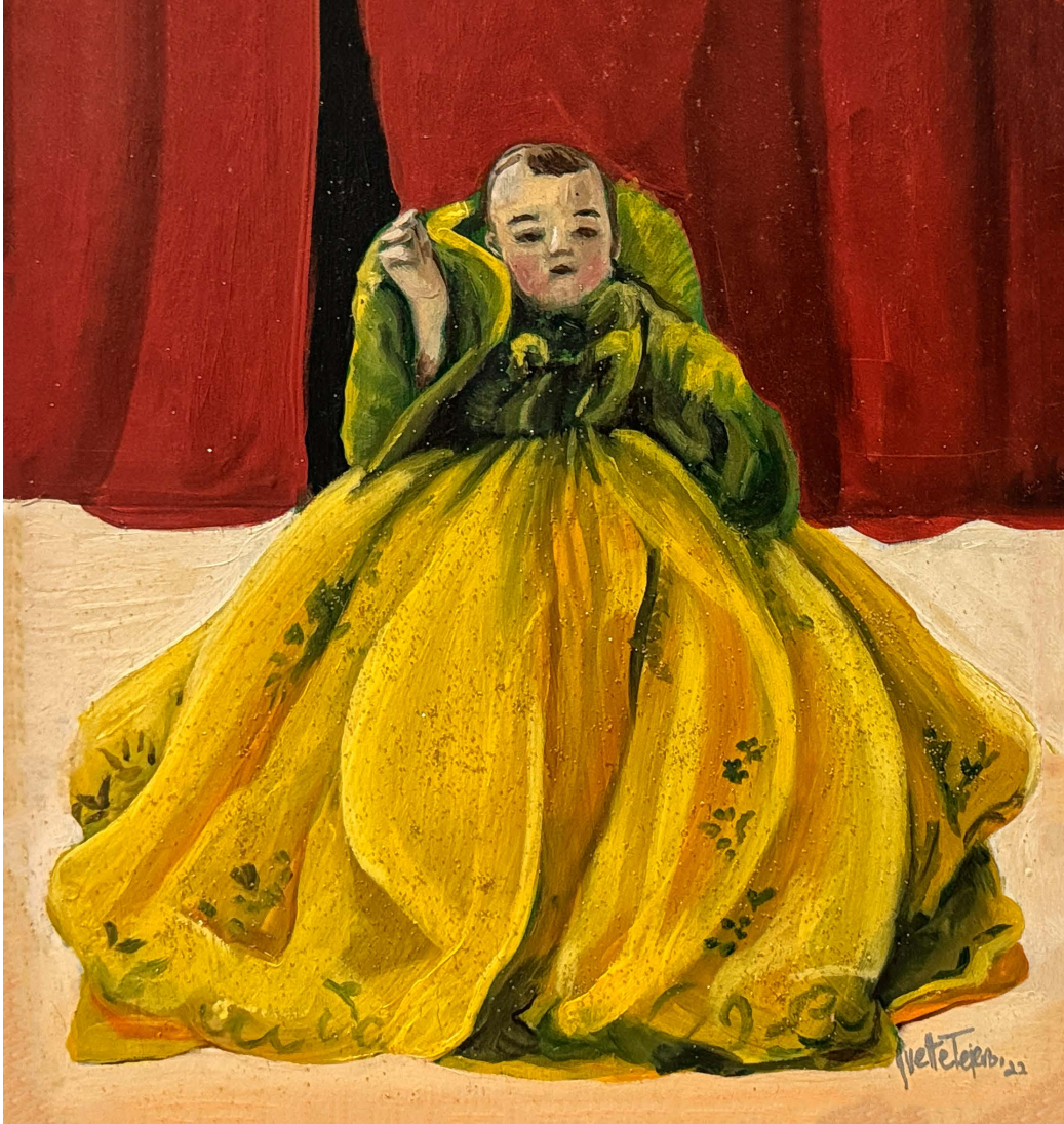
© Ivette Tejero. Niño de Xochimilco.