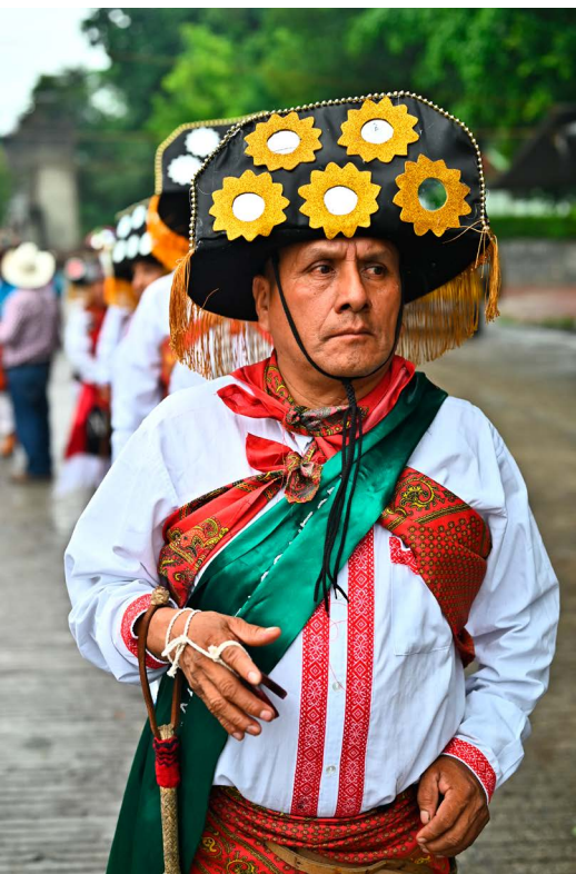
© Miguel Ángel Andrade. De la serie Xochipila .