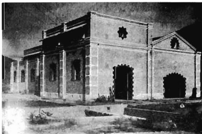
Planta de luz Portezuelo