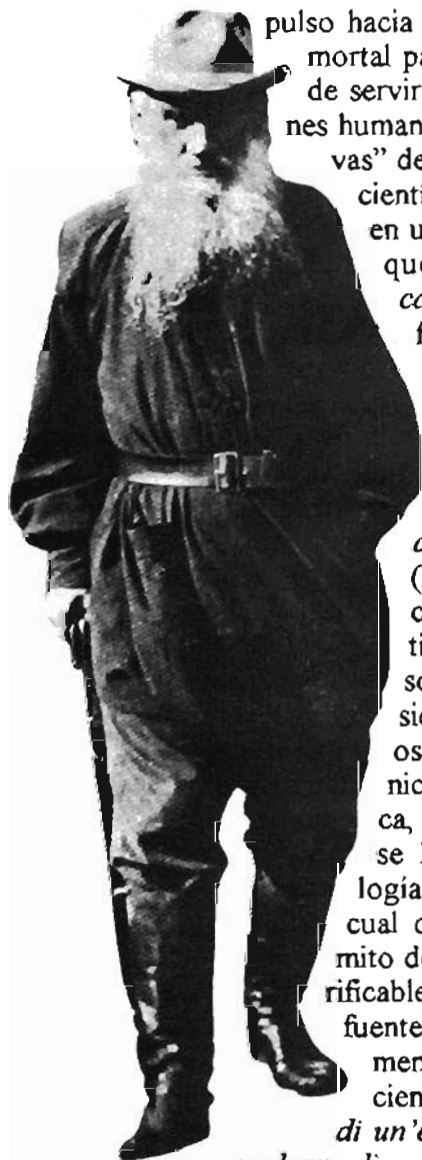
León Tolstoy (1828-1910).

Pero el argumento es defectuoso en un plano más elemental. El perseguir los hechos, actitud de la cual las ciencias constituyen tan sólo el caso más visible, más organizado, no es un error contingente en que incurrió el hombre occidental en algún momento de rapacidad elitista o burguesa. Ese empeño está, según creo, impreso en la estructura misma, en la electroquímica y en el empuje de nuestra corteza cerebral. Estando dado un medio nutritivo y climático adecuado, dicha corteza tenía por fuerza que evolucionar y crecer mediante una constante alimentación de nuevas energías. La ausencia parcial de esta compulsión a indagar y progresar como ocurre en las razas y civilizaciones menos desarrolladas no representa una libre elección o un rasgo de inocencia. Representa, como lo sabía Montesquieu, la fuerza de circunstancias ecológicas y genéticas adversas. El floreciente niño de la ciudad occidental, el neoprimitivo que canta sus cinco palabras de tibetano en la carretera están realizando una charada infantil, fundada en el superávit de riqueza de esa misma ciudad o carretera. No podemos volvernos atrás. No podemos permitirnos los sueños de no saber. Abriremos, así lo espero, la úl-