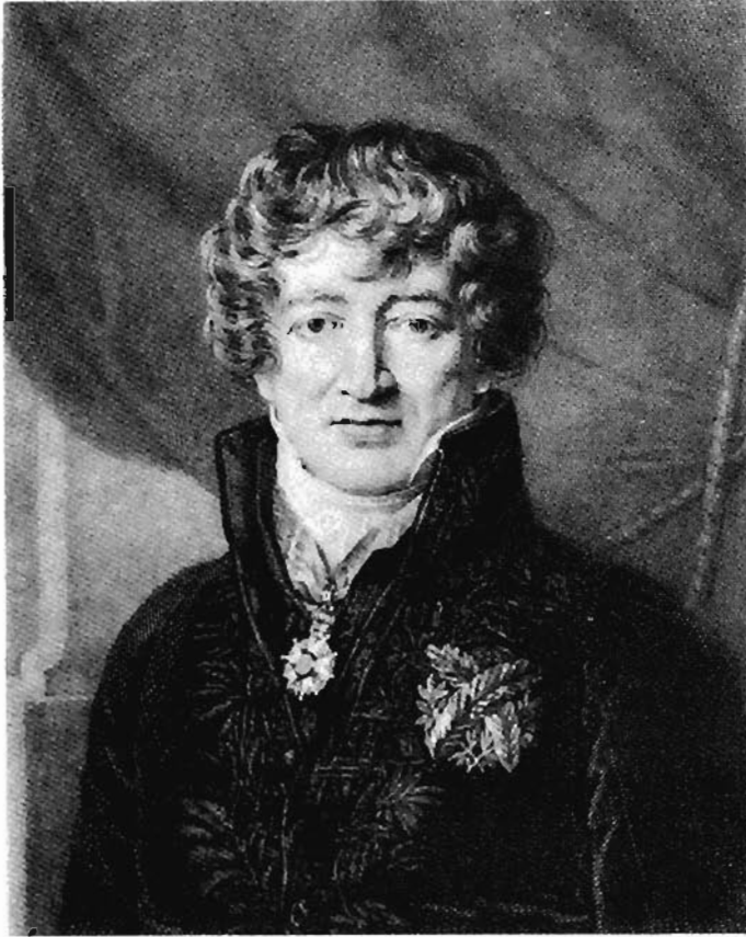
George Cuvier (1769-1832).

hacia atrás, hacia el lugar de las necesarias sombras amadas. Para el científico el tiempo y la luz están adelante.