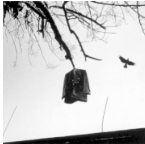
© Graciela Iturbide, Khajuraho, India, 1998.

Nació en la Ciudad de México en 1942. En 1969 ingresa al Centro Universitario de Estudios Cinematográficos de la Universidad Nacional Autónoma de México, donde tuvo como profesor a Manuel Álvarez Bravo quien le propone ser su asistente en 1970. A partir de 1975 sus trabajos son presentados en más de sesenta exposiciones colectivas en varios países: México, Estados Unidos, Francia, Ecuador, Cuba, Austria, Suiza, Italia, España, Alemania, Suecia, Polonia, Nicaragua, India, Japón, Brasil, Inglaterra y Argentina. En 1980 presenta su primera exposición individual en la Casa de la Cultura de Juchitán, Oaxaca. El resultado de diez años en esta comunidad zapoteca es publicado en 1989 en el libro Juchitán de las mujeres . Ha recibido el premio de adquisición en la Primera Bienal de Fotografía, México, D. F., (1980); el premio W. Eugene Smith (1987-1988); la Beca Guggenheim (1988); el Gran Premio Mois de la Photo (1988); el premio Hugo Erfurth (1989); el premio Hokaido (1990) y el premio Reencontres Photographiques (1991).