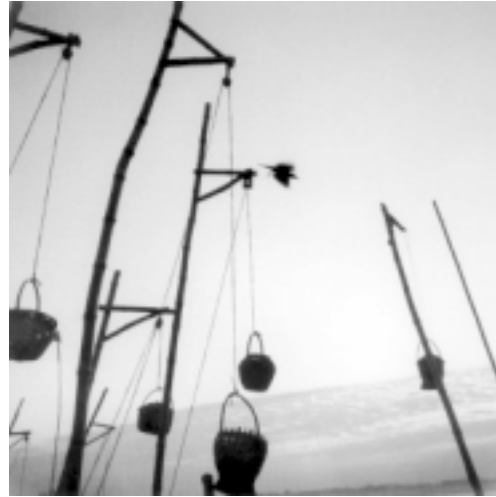
© Graciela Iturbide, Ritual en Varanasi, India, 1999.