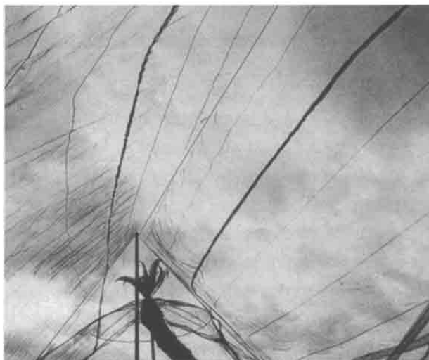
Jardín botánico de Oaxaca, México, 1998-1999.