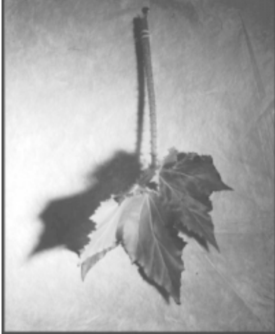
© Patricia Lagarde, de la serie De la clasificación de los seres .

sufren cuando ésta ha entrado pero no está confirmada; el tercero es paliar los daños una vez que ésta ha sido confirmada. 20