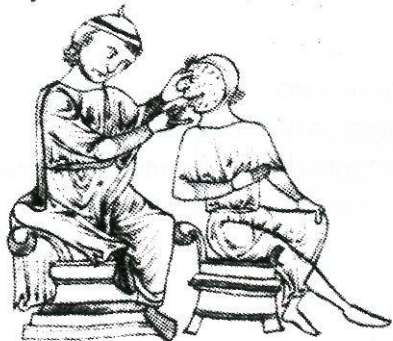
Médico examinando a un leproso. Ilustración de un manuscrito medieval que pertenece a la Universidad Trinity, Cambridge.

dont lune put estre sance si cū la bla Cete q̄ dont estre curer: d'nez ist esp le epoiniez d'nez leqr del malade si garrī si ebbe blanche en ist ne pot el che morphe fauef tel oingnetū pnez eozpient sil builliez cristal uete si