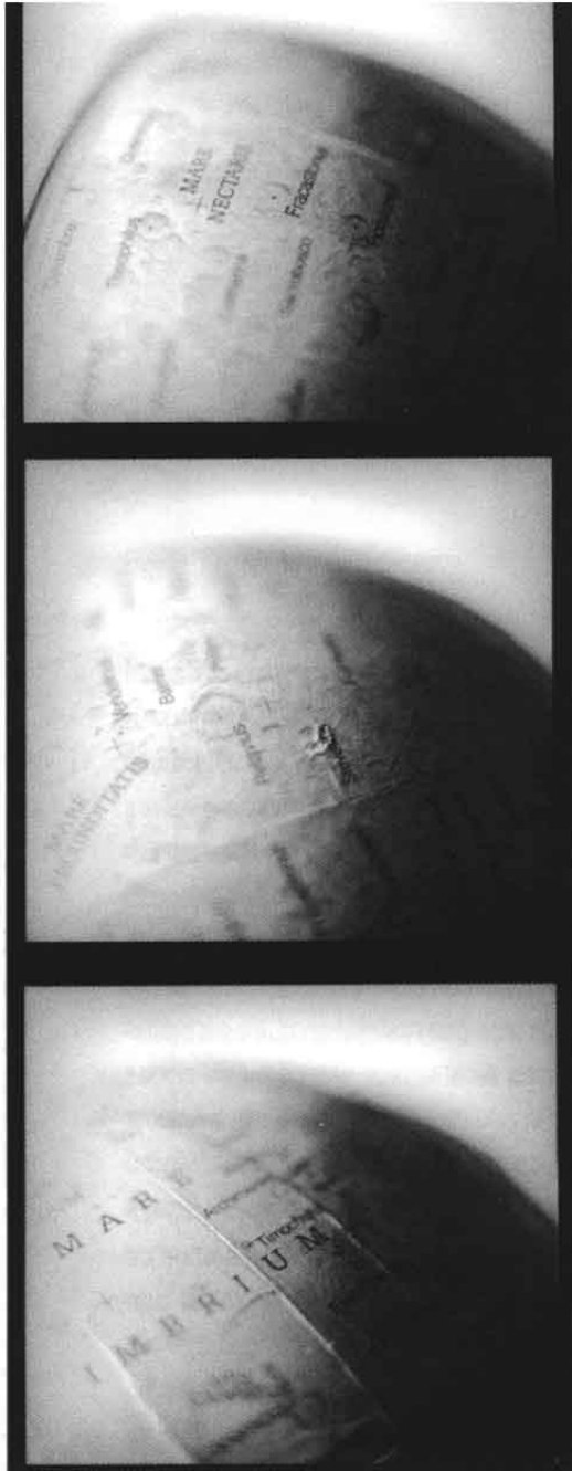
© Patricia Lagarde, de la serie De la clasificación de los seres .