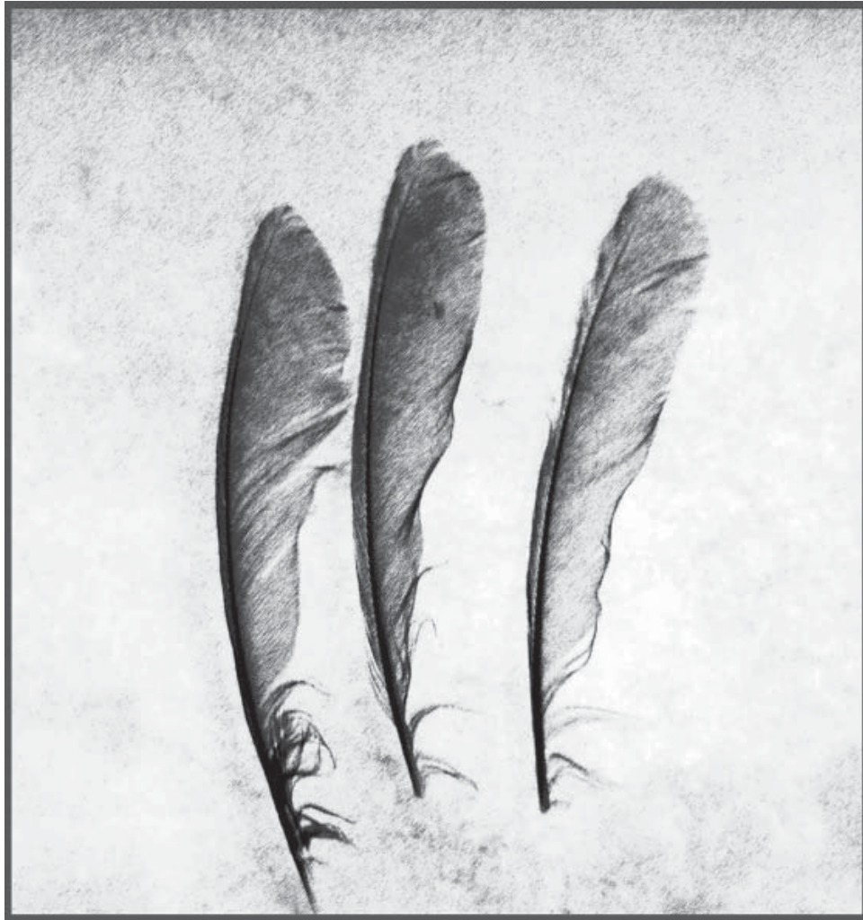
de la serie De la clasificación de los seres.