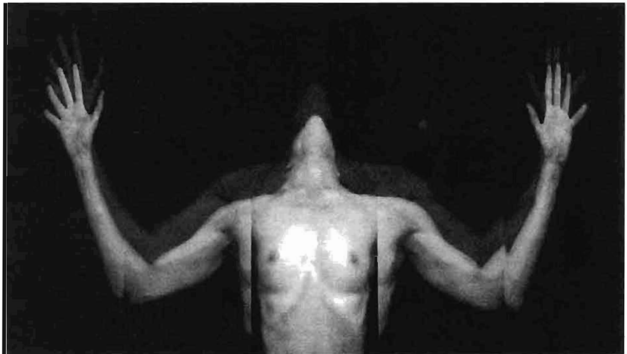
© Gerardo Suter, Cipatli , de la serie Cartografía , 1996.

Nuestro sentido mismo de la situación está en la actualidad articulado por las interven-