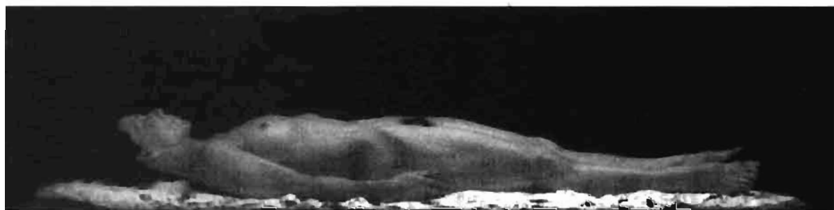
Travesía, de la serie Geografía de la memoria, 1986.

Un famoso dibujo de Daumier que muestra a Nadar en su globo sobre los tejados de París nos sugiere una respuesta. Nadar viaja por el cielo —el viento le acaba de arrebatar el sombrero— fotografiando con su cámara la ciudad y las personas a sus pies.