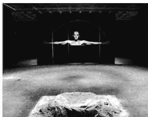
© Gerardo Suter, Bitácora , vista de instalación de impresiones fotográficas sobre acetato transparente y video proyección en blanco y negro, 1997.