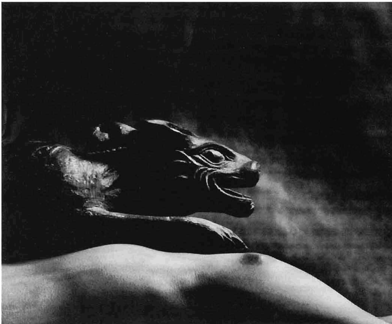
© Gerardo Suter, Un visitante nocturno , de la serie: De esta tierra. Del cielo y los infiernos , 1987.