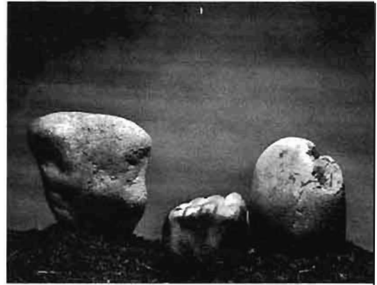
© Gerardo Suter, Huellas al final del tiempo , 1989.

La obra de Gerardo Suter es relevante no sólo en el campo de las bellas artes, sino en el de la tecnología. En sus primeros trabajos vemos la utilización de técnicas fotográficas con un propósito expresivo que toma en consideración no sólo la capacidad del ambiente para reflejar la realidad, al alcance de su propio espacio y tiempo, sino también las características esenciales de los medios. De ahí que, utilizando la luz para cambiar la estabilidad de los cristales de plata, manipulándola según sus deseos, él obtiene una gran diversidad de cualidades visuales.