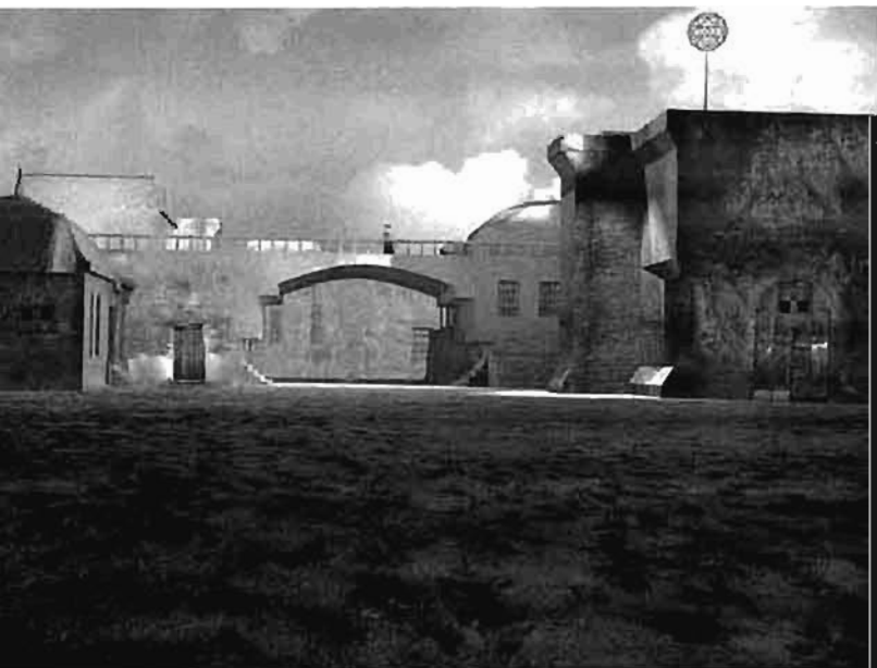
Vista general de las escuelas de Astronomía, Minería y Música de la serie Ciudad Gálvez, 1995-2000