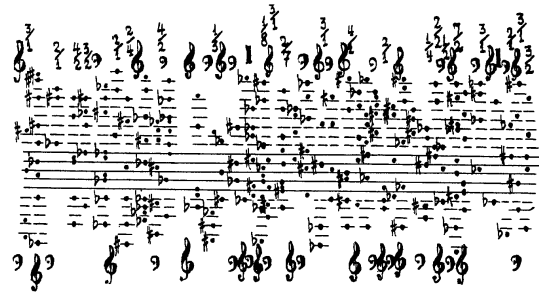
© John Cage, fragmento de Concert for Piano and Orchestra .