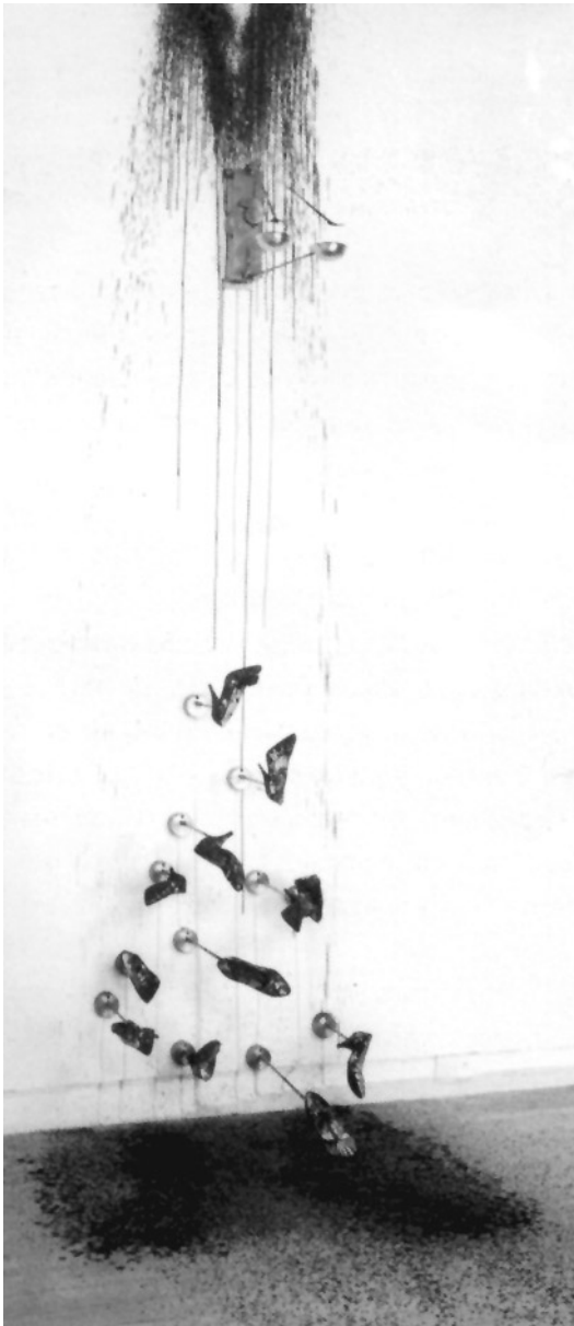
© Rebecca Horn, Die preussische Brautmaschine , 1988.