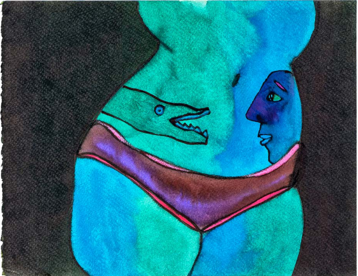
© Javier Anzures Torres. Serie "Mujeres", tinta/papel, 16 x 24 cm, 1977.