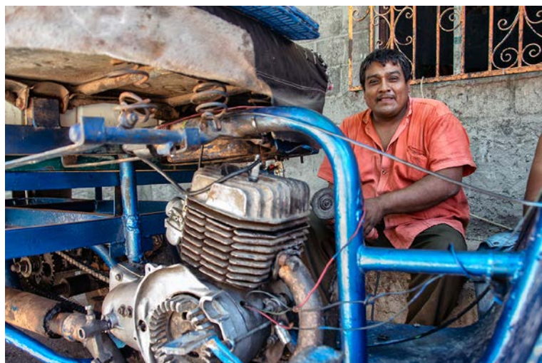
© Enrique Soto. Tehuantepec, Oaxaca XII, 2013.

diversidad, de modo que los componentes dentro de la comunidad y entre comunidades se pueden comparar directamente. Otra ventaja de los números efectivos es que dependen menos del esfuerzo de muestreo que de la riqueza de especies (Beck y Schwanghart, 2010; Chao et al. , 2014), por lo que proporcionan evaluaciones de biodiversidad mejor interpretables y comparables.