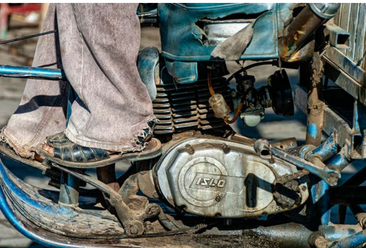
© Enrique Soto. Tehuantepec, Oaxaca XII, 2008.

otras dos localidades, y lo mismo ocurre con el número de especies dominantes ( ^2D ). Esto sugiere que, en general, la perturbación antrópica es un fenómeno que tiene un sustancial efecto negativo en la diversidad.