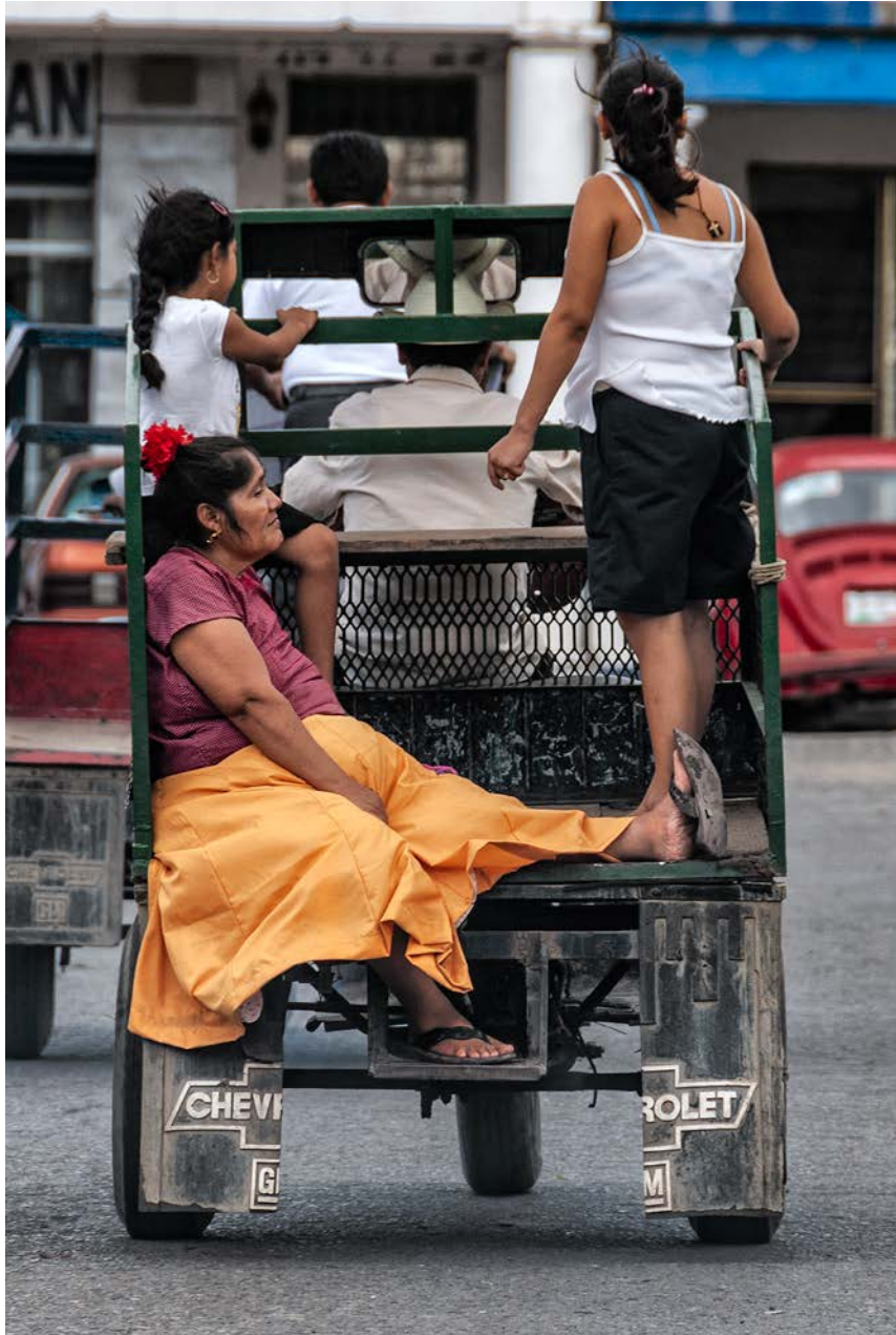
© Enrique Soto. Tehuantepec, Oaxaca XII, 2007.