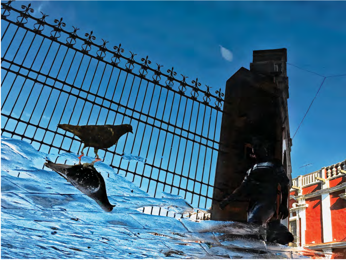
© Carlos Mario Delacruz. De la serie El espejo onírico .