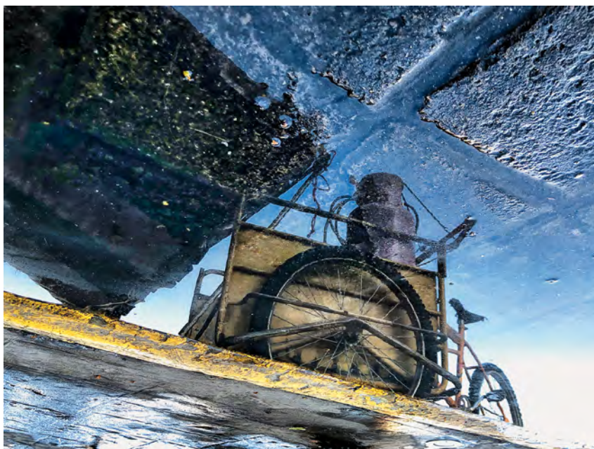
© Carlos Mario Delacruz. De la serie El espejo onírico .

En su época de monero colaboró en medios regionales y nacionales como: La Jornada de Oriente , e-consulta , Las Histerietas de La Jornada , El Chamuco (primera época, la de Rius), El Papá del Ahuizote y otras más.