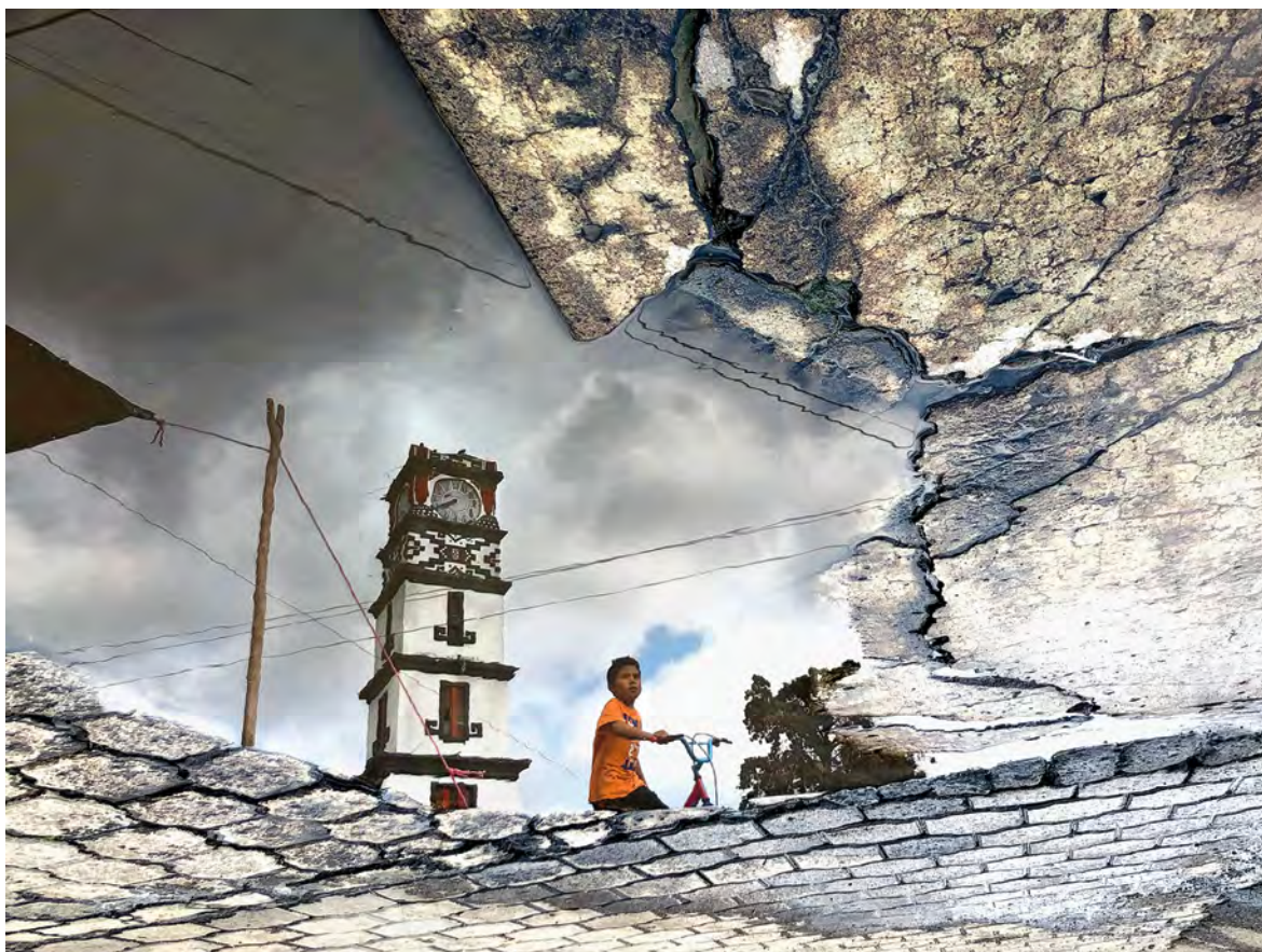
© Carlos Mario Delacruz. De la serie El espejo onírico .