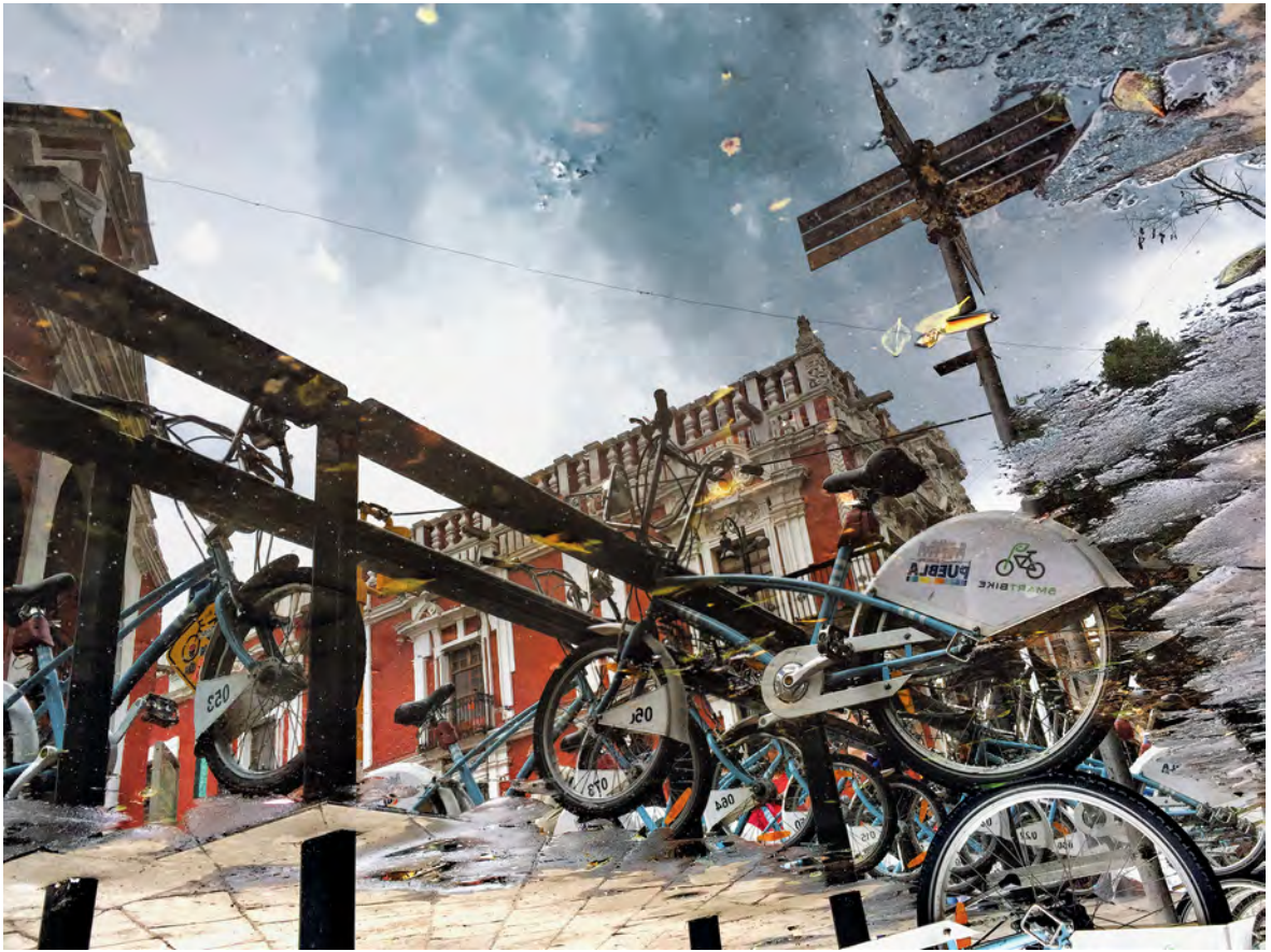
© Carlos Mario Delacruz. De la serie El espejo onírico .