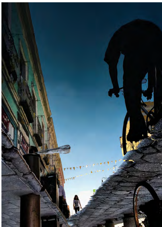
© Carlos Mario Delacruz. De la serie El espejo onírico .