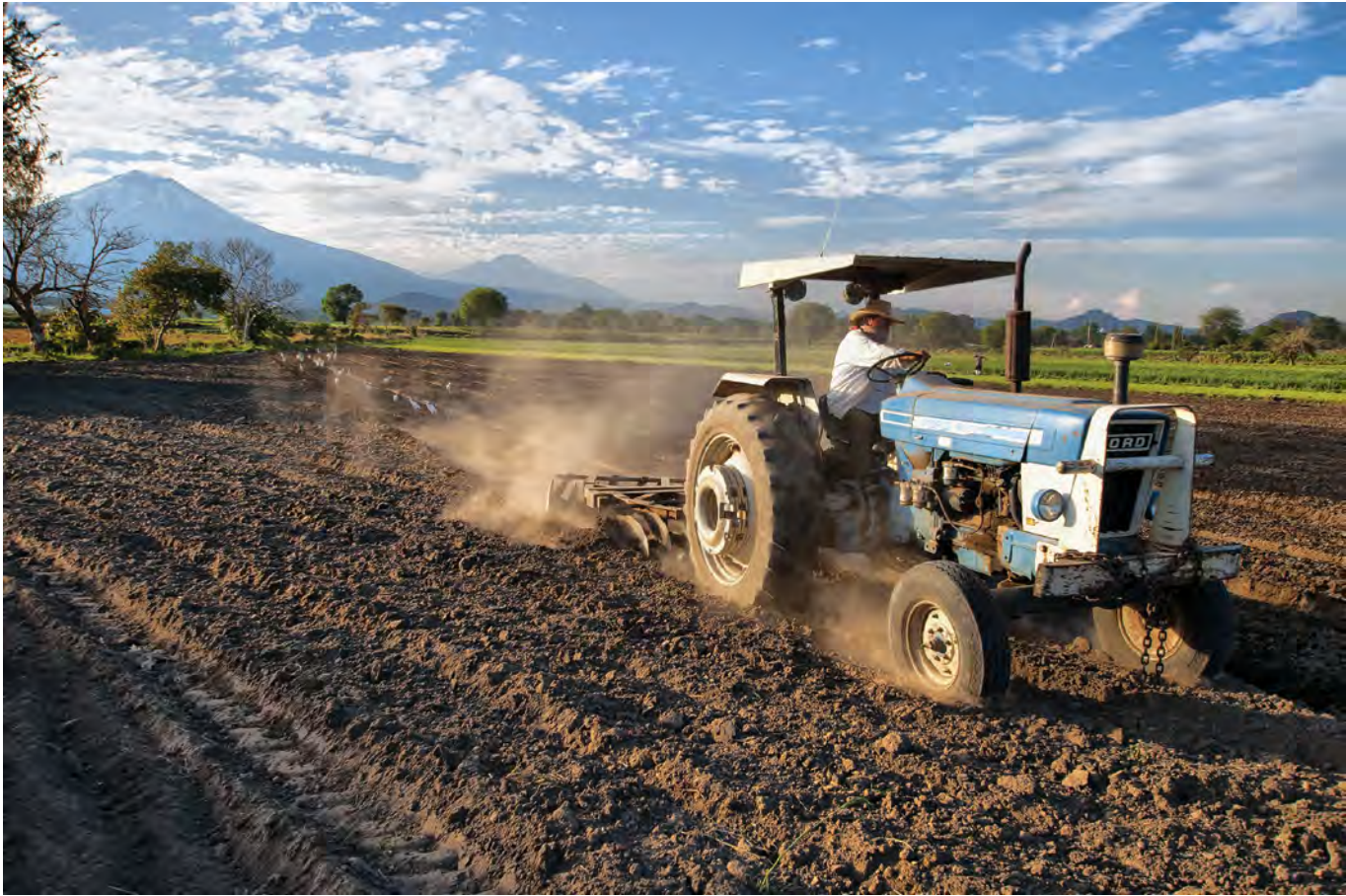
© Enrique Soto. Arando, Puebla, 2010.