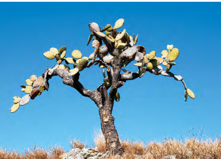
© Enrique Soto. Nopal-Flora y fauna, Puebla, 2007.

Finalmente, es preciso tomar en consideración que la larga historia de irrigación y desarrollo agrícola del área de la reserva, se originó en ausencia de grandes ríos navegables, en un territorio de topografía accidentada, sin presencia de animales de carga, ni caminos amplios.