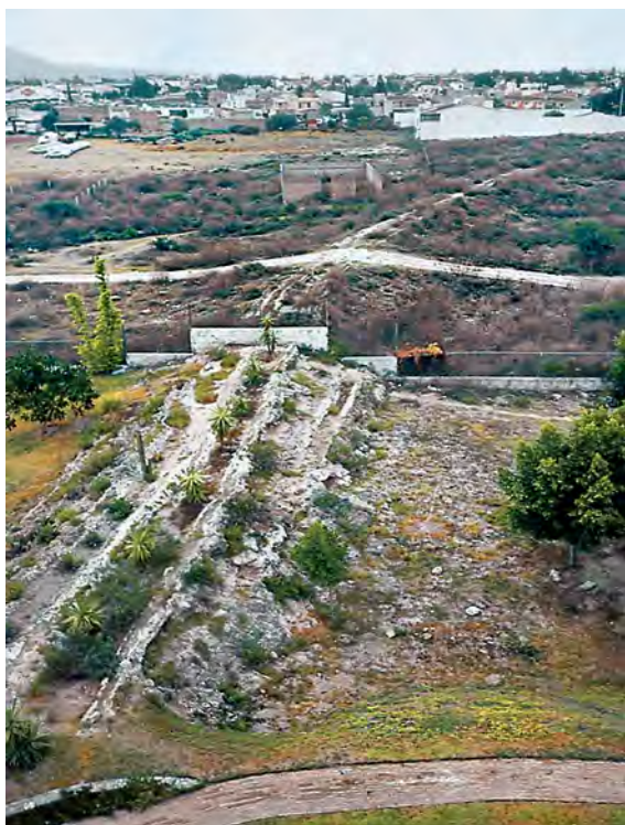
Figura 3. Canal antiguo. Aldea Infantil, Residencial Puesta del Sol, Tehuacán.

En Zapotitlán, en un área de barrancas equivalente a 13 km 2 , se contabilizaron más de 300 de estos pequeños diques con altura entre tres a ocho metros. En el resto del Valle de Tehuacán la cantidad de tales diques, en un cálculo conservador, debe ser 200 veces superior. Esto nos da una idea del esfuerzo invertido en la construcción y mantenimiento de estas construcciones en el pasado, aunque la estrategia de manejo de agua y humedad siempre fue una combinación de técnicas muy variadas de acuerdo a las posibilidades del terreno, el régimen de lluvias, la vegetación natural y las plantas cultivadas.