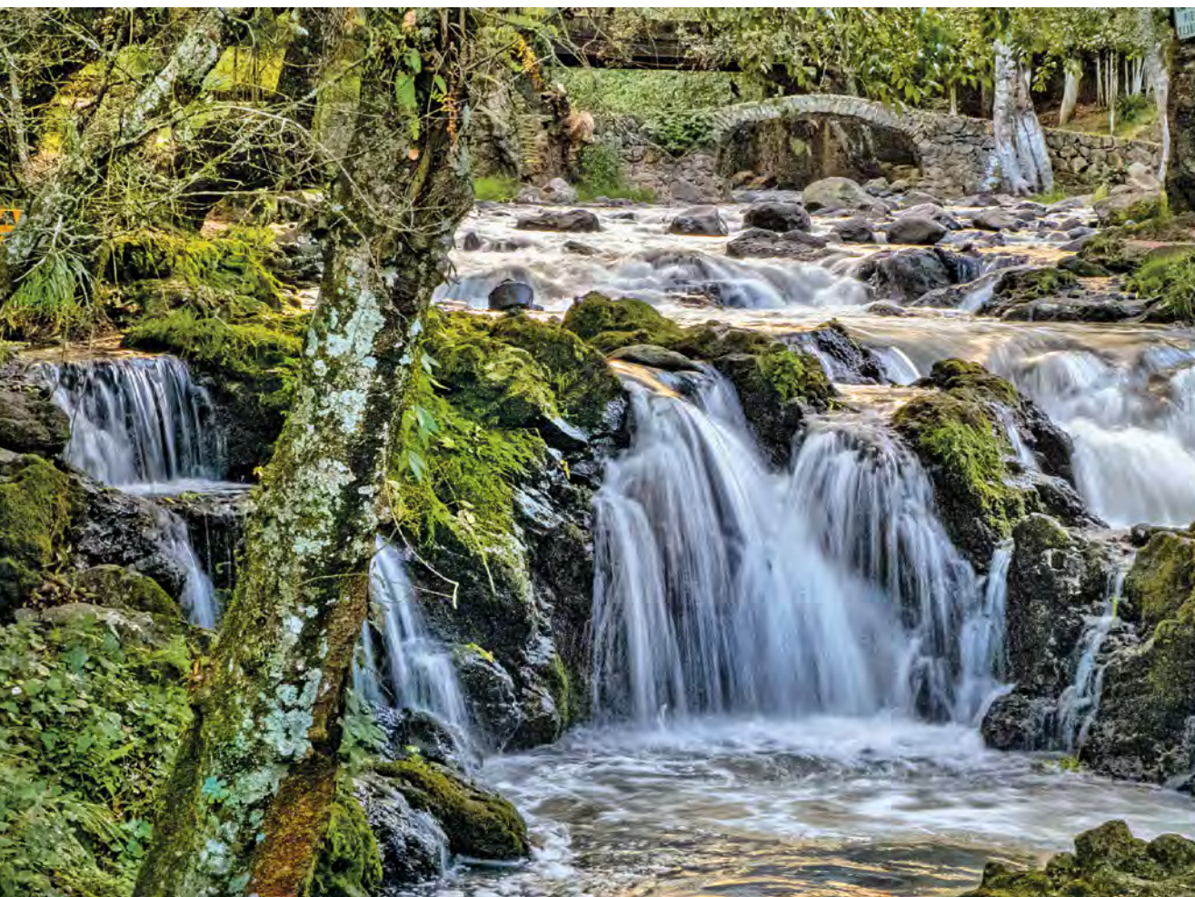
Cascadas de Quetzalapan, Chignahuapan, Puebla, 2011.

seguros para la caza y trapeo de animales de los que se obtiene alimento y pieles (Figura 4). Lo mismo sucede con las terrazas antiguas y los muros contruidos sobre barrancas que retienen suelos y humedad generando microambientes favorables a las actividades humanas. Es por esto que hasta el día de hoy se reproducen ahí pastos silvestres, hierbas comestibles y legumbres, plantas medicinales y carrizos que se utilizan para hacer cestería, petates, techos, esteras, y cercas. En el pasado, estas plantas fueron empleadas para fabricar flechas y toda clase de cubiertas de protección para personas y casas. Todos estos recursos crecen en partes cercanas a los canales y terrazas contruidas a lo largo del Valle de Tehuacán por siglos.