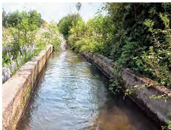
Figura 4. Canal antiguo reutilizado, San José Miahuatlán.

Al evaluar la evolución de los complejos sistemas de irrigación en la región de Tehuacán-Cuicatlán es preciso considerar que fueron resultado de un largo proceso de experimentación con los recursos hídricos y plantas comestibles que comenzó al menos desde 5,000 a.C., o antes, como está atestiguado en el pozo de San Marcos Necoxtla. En los siglos subsiguientes, la toma de decisiones sobre el uso de terrazas y desviación de corrientes y escurrimientos