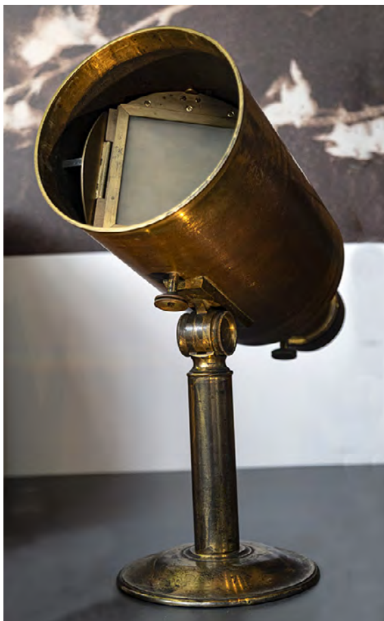
© Enrique Soto. Museo Nacional de Escocia, Edimburgo, 2017.

INAFED (s.f.). Enciclopedia de los Municipios y Delegaciones de México . Recuperado el 04 de noviembre de 2019, de Tlacotalpan: http://siglo.inafed.gob.mx/enciclopedia/EMM30veracruz/municipios/30178a.html .