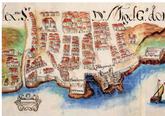
Plano de la ciudad de Santa Cruz de Tenerife. Tiburcio Rosell, 1701, Tenerife, G. M. (13 de julio de 2020). Plan Especial de Protección del Conjunto Histórico del Antiguo Santa Cruz. Obtenido de Gobierno de Canarias: http://www.gobiernodecanarias.org/politica_territorial/descargas/EAE/PECH_ANTIGUO_SANTA_CRUZ/DOCUMENTO_BORRADOR_DEL_DOCDOC_4_PROPUESTA_CATALOGO_DOC_TECNICO.PDF .

presencia de nativos de Canarias en Trinidad que se dedicaban al cultivo del tabaco, y se menciona también que Colombia formaba parte de la ruta del comercio tabacalero (Méndez Guerrero, 2009).