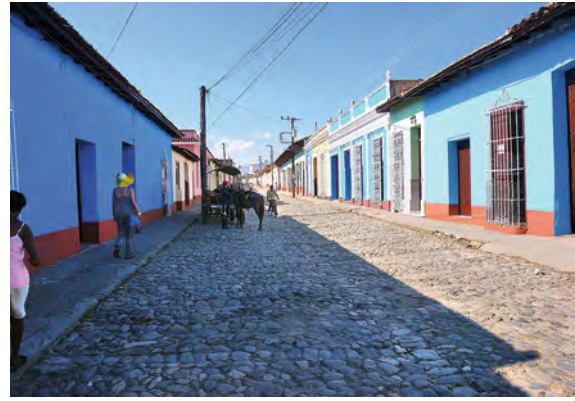
Calle típica en Trinidad, Cuba STORIES, L. A. (13 de julio de 2020). Trinidad, Kuba-Kolonialna perla Ameryki Łacinijskiej. Obtenido de Latin American Stories: https://latinamericanstories.com/trinidad-kuba-kolonialna-perla-ameryki-lacinskielj/ .

españolas y caribeñas de excepcional importancia y calidad.