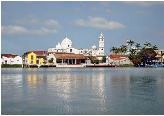
Tlacotalpan desde el río.