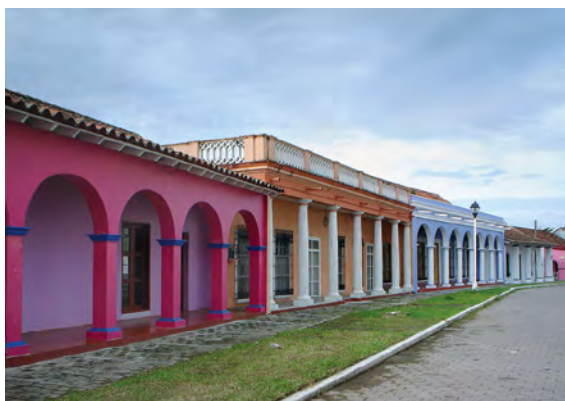
Calle Típica de Tlacotalpan.