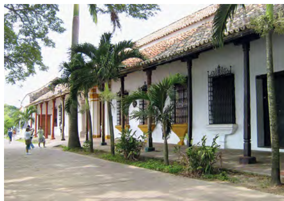
Portales de La Marquesa. Calle de La Albarrada. Santa Cruz de Mompox.

La puerta de río en Mompox ha sido restaurada en los últimos años y la de Tlacotalpan fue modificada y ampliada para convertirla en el Palacio Municipal. En torno a estas plazas se aprecia la evolución de la arquitectura entre los estilos barroco tardío y neoclásico que preponderaban en los siglos XVIII y XIX.