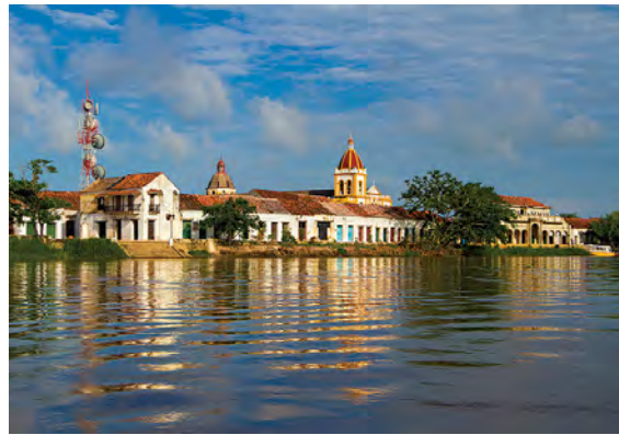
Mompox desde el río. Franco Ossa, L. V. (2015). Paisaje urbano, histórico y cultural de Santa Cruz de Mompox y el Río Grande de la Magdalena . Quiroga (8), 78-92.

de Colombia. Mompox se desarrolló, por su ubicación estratégica, entre el puerto de Cartagena y el interior del territorio norte, lo que le permitió tener una relevancia logística y comercial durante el Virreinato de la Nueva Granada. En la actualidad, la ciudad tiene una población aproximada de 26,000 habitantes y aún mantiene vigentes las celebraciones de su carnaval, de la Virgen de la Candelaria y la Semana Santa (Colombia, s.f.). Se incluyó en la Lista del Patrimonio Mundial de la UNESCO en 1995 con los siguientes criterios: