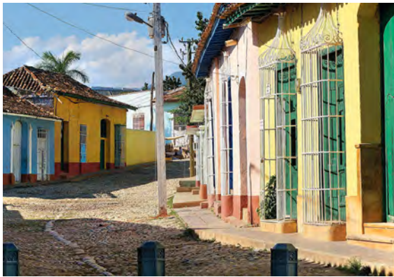
Calle típica en Trinidad, Cuba STORIES, L. A. (13 de julio de 2020). Trinidad, Kuba-Kolonialna perła Ameryki Łacińskiej. Obtenido de Latin American Stories: https://latinamericanstories.com/trinidad-kuba-kolonialna-perla-ameryki-lacinskiej/ .