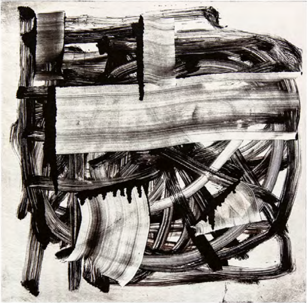
© Marco Antonio Velázquez Ramos. Sin título , 2016. Monotipo.