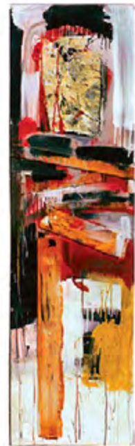
© Marco Antonio Velázquez Ramos. Sin título , 1996. Mixta sobre tela, 180 x 150 cms.

creativo, un ejercicio contemplativo del óleo brutal de los que requieren un bastidor fuerte para que la pintura tome su lugar a capricho. Si preguntas por Marco Velázquez, el pintor, muchos te sabrán decir quién es. Pero si entre el gremio artístico preguntas por “Marco el de los marcos” también sabrán a quién te refieres. Eso es un indicador de la clase de artista y artesano que es Marco. Un pintor detallista que prepara su obra desde el mismo bastidor, una persona que antes de ensuciarse las manos con pintura, sabe componer el armazón de su bastidor y escoger los mejores materiales para el soporte de su trabajo. Para él se trata de un ejercicio de honestidad: hay que conocer el oficio.