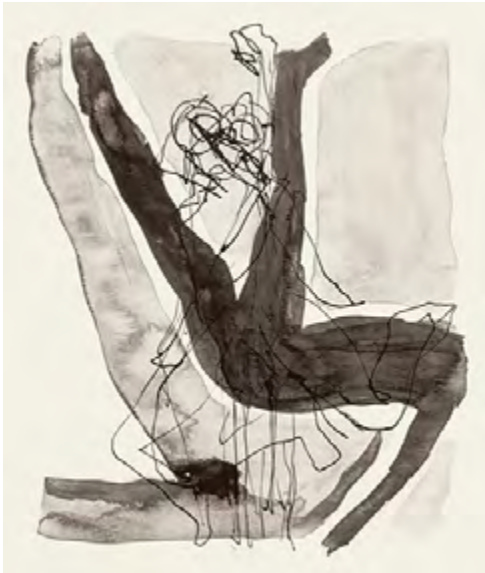
© Marco Antonio Velázquez Ramos. Desnudo , 2007. Dibujo en tinta china y acuarela.