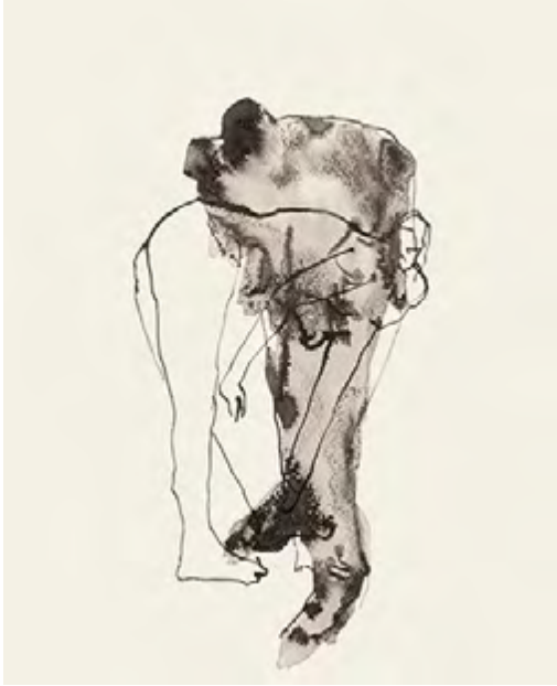
© Marco Antonio Velázquez Ramos . Desnudos , 2007. Dibujo en tinta china y acuarela.