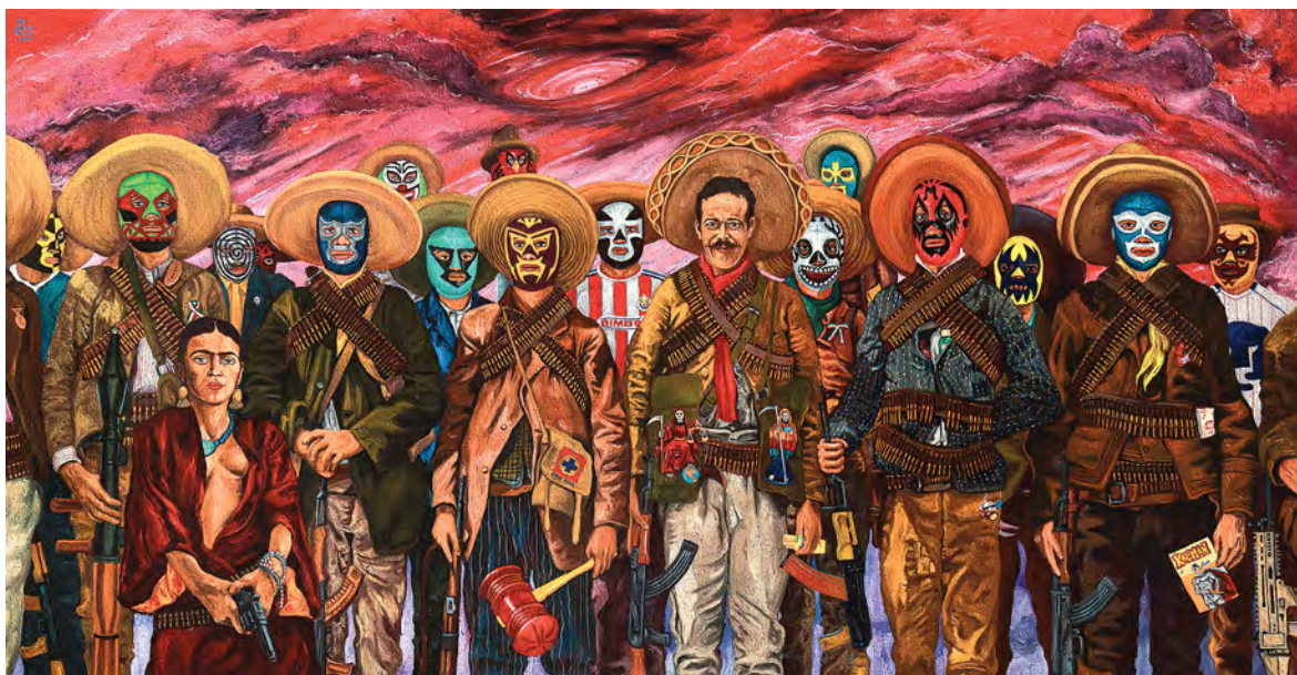
© Mauro Terán. Almas rebeldes con Pancho Villa , óleo/tela, 80 x 150 cm, 2014.

sólida. 5 Y por todo ello estos factores son aceptados gustosamente y estimados en alto grado por una porción muy importante de la población en el mundo islámico. En otras áreas del Tercer Mundo se encuentran numerosos fenómenos similares. Constituyen evidentemente piedras angulares de una identidad colectiva que viene de muy atrás y que durará todavía por largo tiempo. En muchos casos se trata de una combinación de un arcaísmo autoritario con modelos modernos de administración pública centralizada y con tecnologías muy avanzadas en el campo productivo.