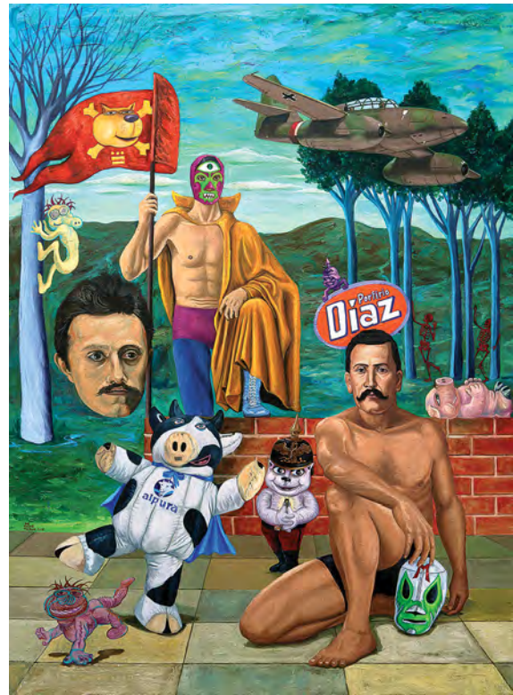
© Mauro Terán. Casco prusiano , óleo/tela, 160 x 120 cm, 2016.

a un disenso creador. Partidos y movimientos izquierdistas no han modificado (y no han querido modificar) esta constelación básica. En última instancia, la apelación a la soberanía popular es solo una cortina exitosa que encubre los saberes y las prácticas tradicionales de estratos privilegiados muy reducidos.