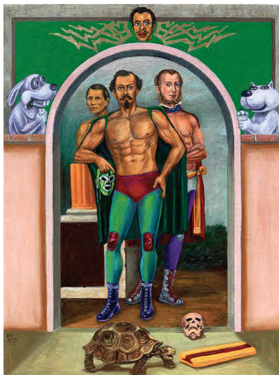
© Mauro Terán. Esos muchachos , óleo/tela, 60 x 45 cm, 2016.

El principio doctrinario que subyace a este modelo de jurisprudencia es estrictamente colectivista y anti-individualista. No existen culpables individuales,