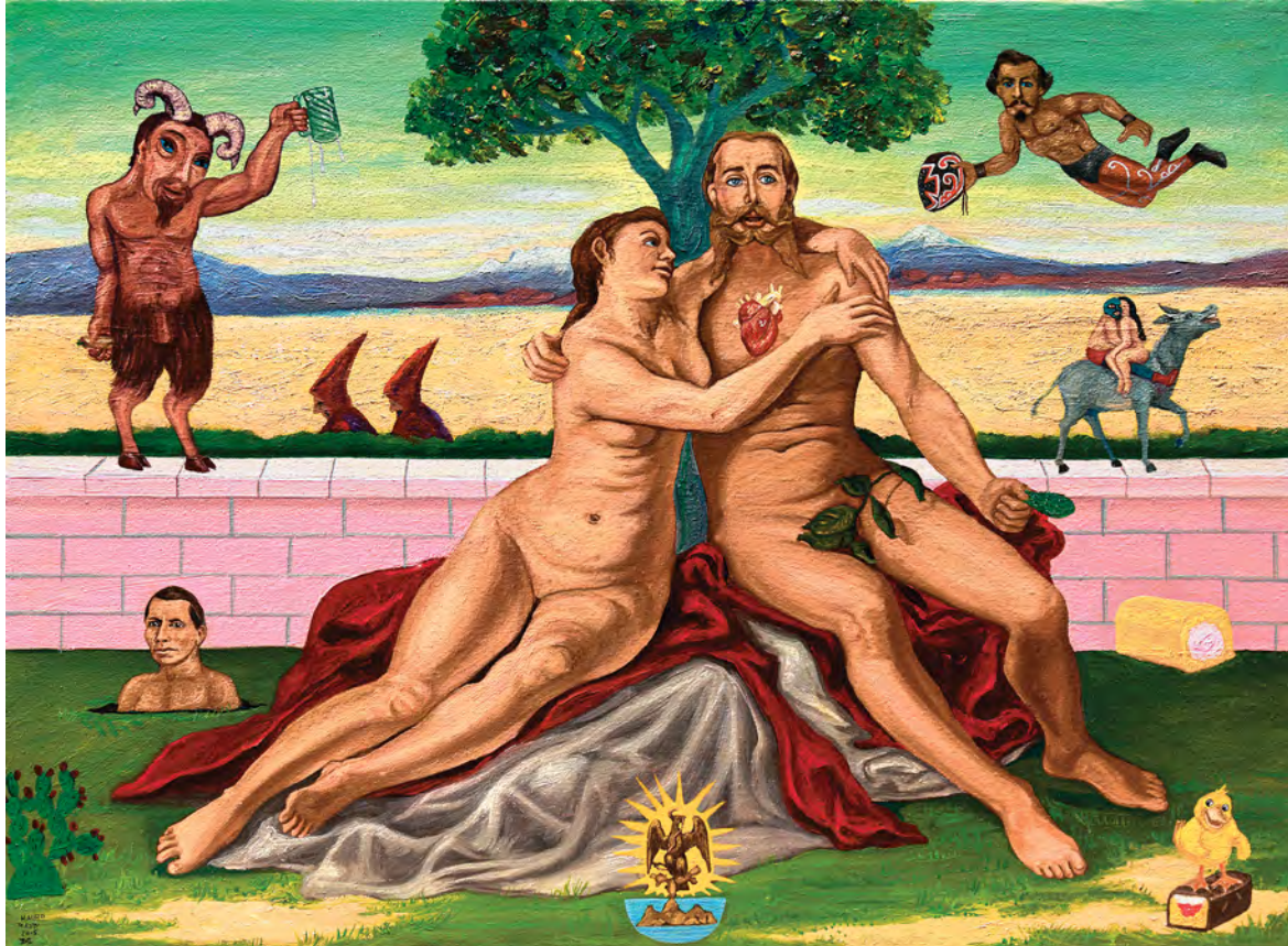
© Mauro Terán. Maximiliano y Carlota , óleo/tela, 60 x 80 cm, 2015.

un sistema de detención o de prisión. Las penas dictadas son generalmente castigos físicos inmediatos (latigazos, picota, cepo) y el resarcimiento material del daño. Los castigos corporales consuetudinarios son percibidos como una modalidad más humana y más progresista que las penas de prisión. Se asevera que el encierro “occidental” representa también un castigo tanto físico como psicológico, más grave que los latigazos, pues bloquea “el horizonte de visibilidad del condenado”. 21 La lesividad con respecto a los castigados sería mucho mayor en la justicia occidental. Las labores comunales obligatorias (una de las formas usuales de castigo) podrían ser percibidas desde la óptica occidental como trabajos forzados, pero, como el condenado no es privado de su libertad, constituirían un modelo muy avanzado de resarcimiento de daños. 22 No se contempla una investigación objetiva y pericial de los delitos imputados ni se investigan las pruebas. En lugar de la investigación pericial de los antecedentes, la justicia comunitaria recurre a menudo a los oráculos