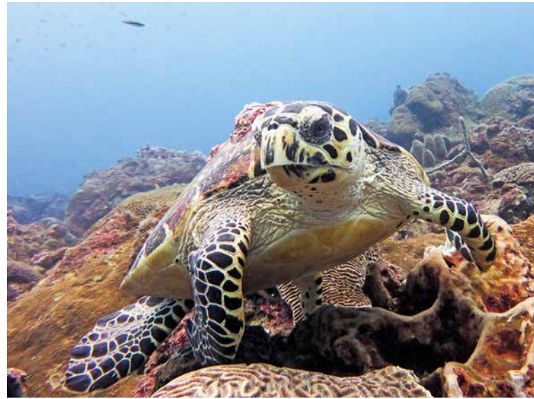
Tortuga carey ( Eretmochelys imbricata). Sistema Arrecifal Veracruzano.

En su edición del 28/01/19, el diario argentino Clarín publicó una nota sobre las últimas semanas vividas por el sociólogo norteamericano Erik Olin Wright. A punto de terminar un importante libro, Wright recibió la noticia de que padecía un cáncer de acelerada evolución. Se dedicó entonces a escribir sus experiencias de enfermo terminal. “Me queda una cantidad limitada de tiempo en esta maravillosa forma de polvo de estrellas”, escribió. “Parece bastante mezquino quejarse después de haber vivido 72 años en esta extraordinaria forma de existencia que pocas moléculas en el