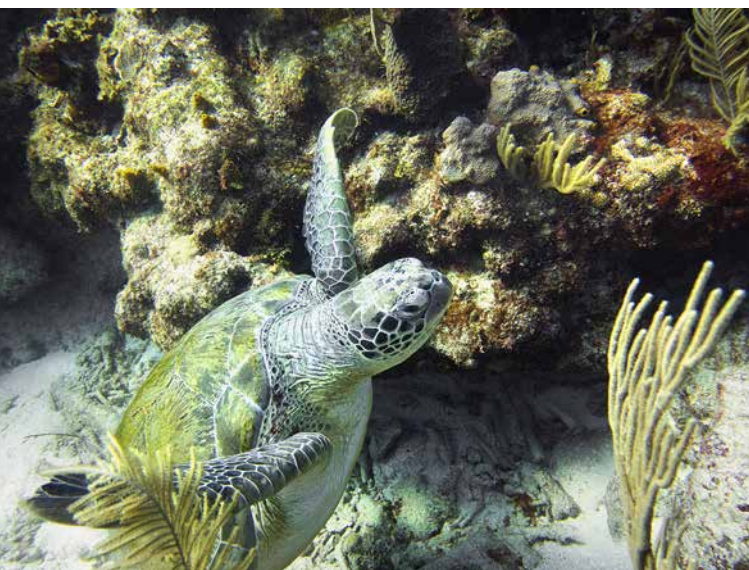
Tortuga prieta ( Chelonia mydas ). Akumal, Quintana Roo.

a otro de mayor complejidad o de más compleja organización. El lenguaje, desde luego, es un sistema complejo.