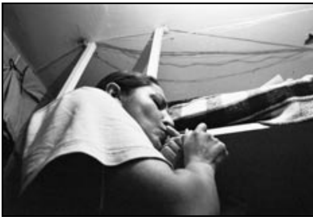
de la serie Las horas negras, México, D.F., 2000-2004.