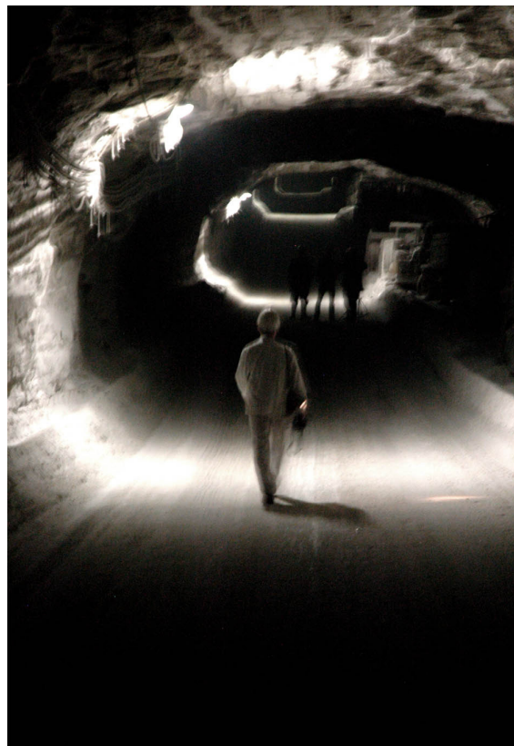
© Valeria Schwarz, Making of The Shift, videoinstallation by Julian Rosefeldt.

Francisco Javier Jiménez Moreno. Escuela de Biología, BUAP email: pacorex4@hotmail.com