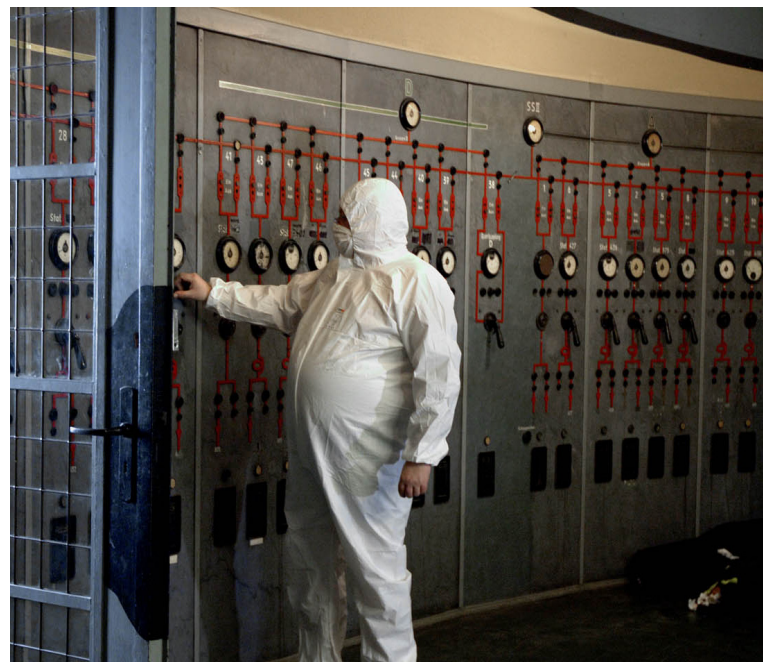
© Valeria Schwarz, Making of The Shift , videoinstallation by Julian Rosefeldt.

Cuatro especies han sido introducidas, viven en el estado y tienen poblaciones silvestres: la garza garrapatera ( Bubulcus ibis ), originaria de África y llegada a América a mediados de los cincuenta del siglo XX; la paloma común ( Columba livia ), introducida en 1606; el estornino pinto ( Sturnus vulgaris ) y el gorrión común o chillón ( Passer domesticus ), ambos introducidos en el Central