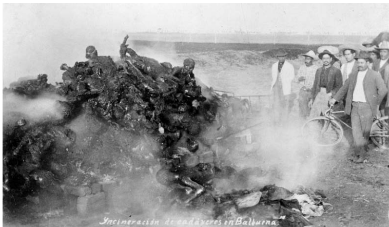
Incineración de cadáveres en Balbuena , Distrito Federal, febrero de 1913; Samuel Tinoco; Novedades, 5 de marzo de 1913. © Inv. No. 37306, Fondo Casasola, SINAFO-Fototeca Nacional del INAH.

Hay fotos terriblemente trágicas, como la de esos niños llorando al lado de un ataúd, donde yace el cadáver de un zapatista fusilado en Ayotzingo; o francamente macabras, como la del joven muerto, con la cara destrozada, tirado en el piso, señalando su rostro con el dedo índice de la mano izquierda.