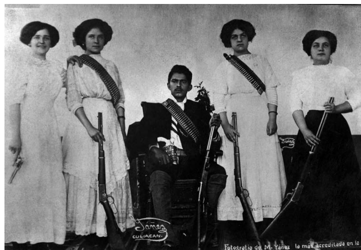
“General Ramón Iturbe”, acompañado por lo que se decía era su “Estado Mayor Femenino”; Topia, Durango, marzo de 1911; Mauricio Yáñez; La Semana Ilustrada , 28 de abril de 1911. © Inv. No. 186666, Fondo Casasola, SINAFO-Fototeca Nacional del INAH.

Las muchachas más bonitas de la población se habían refugiado en el consulado de los Estados Unidos. Los federales me habían dado la mala fama de que me robaba a las muchachas y estaban asustadas. Eso no era verdad, nunca robé una muchacha. El cónsul me las presentó. Así fue como ellas se dieron cuenta de que yo no era como decía la gente. Nos hicimos amigos y cuatro de ellas quisieron retratarse conmigo tomando algunas armas para hacerlo. Total que por esa foto nació otra leyenda: que Iturbe, jefe rebelde, tenía un estado mayor femenino.