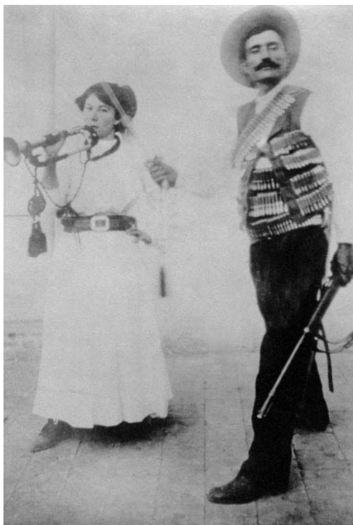
“Tipos revolucionarios”, Ciudad Juárez, Chihuahua, mayo de 1911; E. Herreirás. © Inv. No. 373891, Fondo Casasola, SINAFO-Fototeca Nacional del INAH.

Hay fotos de combate auténticas y simuladas, de tropas posando para la cámara en plena campaña o en un estudio fotográfico, es más, hay fotos de estudio en las que se retrata gente con armas pero que no es combatiente y con las cuales se hacen postales de “tipo revolucionario”. Entre las fotos simuladas sobresale la del general Ramón Iturbe acompañado por lo que