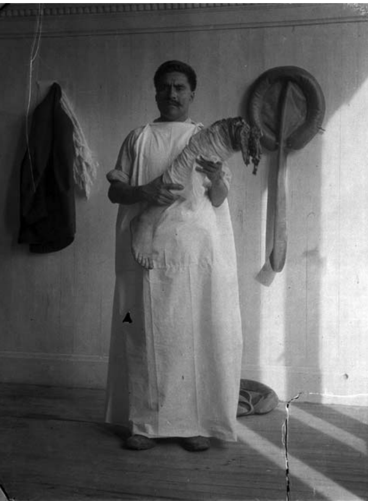
Médico con la pierna amputada de un federal, Chihuahua, 1912.