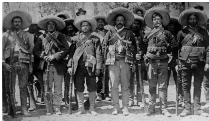
Pancho Villa con miembros de su ejército en un campamento maderista, Ciudad Juárez, Chihuahua, abril de 1911.

O esa otra, francamente surrealista, que muestra a un cirujano grandote y bigotón, con un atavío como de monja, sosteniendo entre sus brazos una enorme pierna recién amputada, retratado en una pared de la que cuelgan, sostenidos por un clavo, su ropa y una especie de gigantesco condón recién utilizado.