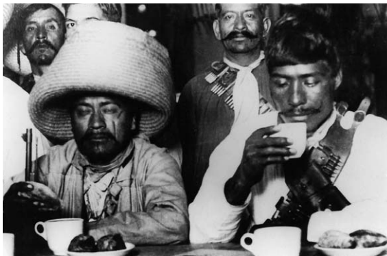
Zapatistas en Sanborn's, Distrito Federal, diciembre de 1914.

El grupo de “los científicos” porfirianos encontraba atractivo el discurso de las proteínas y los carbohidratos porque proporcionaba una explicación al subdesarrollo nacional sin recurrir a las doctrinas de un racismo extremo que condenaba al país a un atraso eterno. El racismo alimentario dejaba entrever una esperanza de superación y progreso si la población nativa se alimentaba adecuadamente, y más aún si adoptaba las costumbres europeas. La fe en el progreso importado de Europa se derivaba de una premisa fundamental: que era la cultura y no la raza la que determinaba la modernidad. No era necesario ser europeo de nacimiento; bastaba con actuar como europeo, vestir como europeo, comer como europeo.