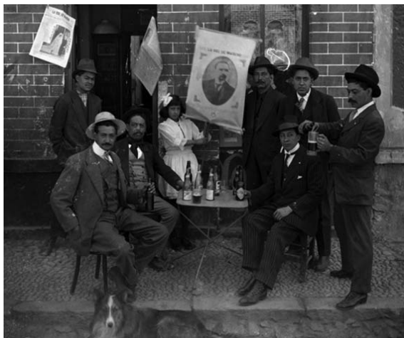
Partidarios maderistas, Distrito Federal, 1911.

Otras fotos tienen un nítido simbolismo ciudadano, como aquella donde está Francisco I. Madero votando en el Distrito Federal el 1 de octubre de 1911. Un sufragio que más de cien años después sigue sin ser respetado. Y arriba de ella, otra de partidarios maderistas bebiendo cervezas en una mesita dispuesta en la calle, ante un pendón con la foto de su candidato, todos a medios chiles, con los sombreros hacia atrás y un perro collie echado a sus pies.