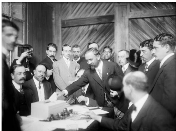
Francisco I. Madero votando, Distrito Federal, 1 de octubre de 1911.

No pude continuar porque las lágrimas me rodaban de los ojos, no sé si del sentimiento de verme tratado de aquella manera sin merecerlo, o quizá de cobardía, como han gritado tanto mis enemigos cuando me han huido. Yo dejo que el mundo juzgue mis lágrimas en aquellos supremos momentos: si fue la cobardía la que las hizo brotar, o fue la desesperación de ver que me iban a matar sin que yo supiera por qué.