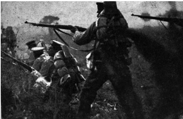
Federales atacando a los zapatistas, Amecameca, 1911.

Llama la atención las pocas fotos que hay de combates auténticos y las todavía más pocas tomadas en el campo, una de ellas es un enfrentamiento de federales, que aparecen en la imagen atacando quizá a tropas zapatistas en Amecameca. Su autenticidad reside en la premura con la que está tomada y en lo borroso del resultado. Más tarde, dice John, el desenfoque fue un recurso aprovechado para darle realismo a fotografías que simulaban combates.