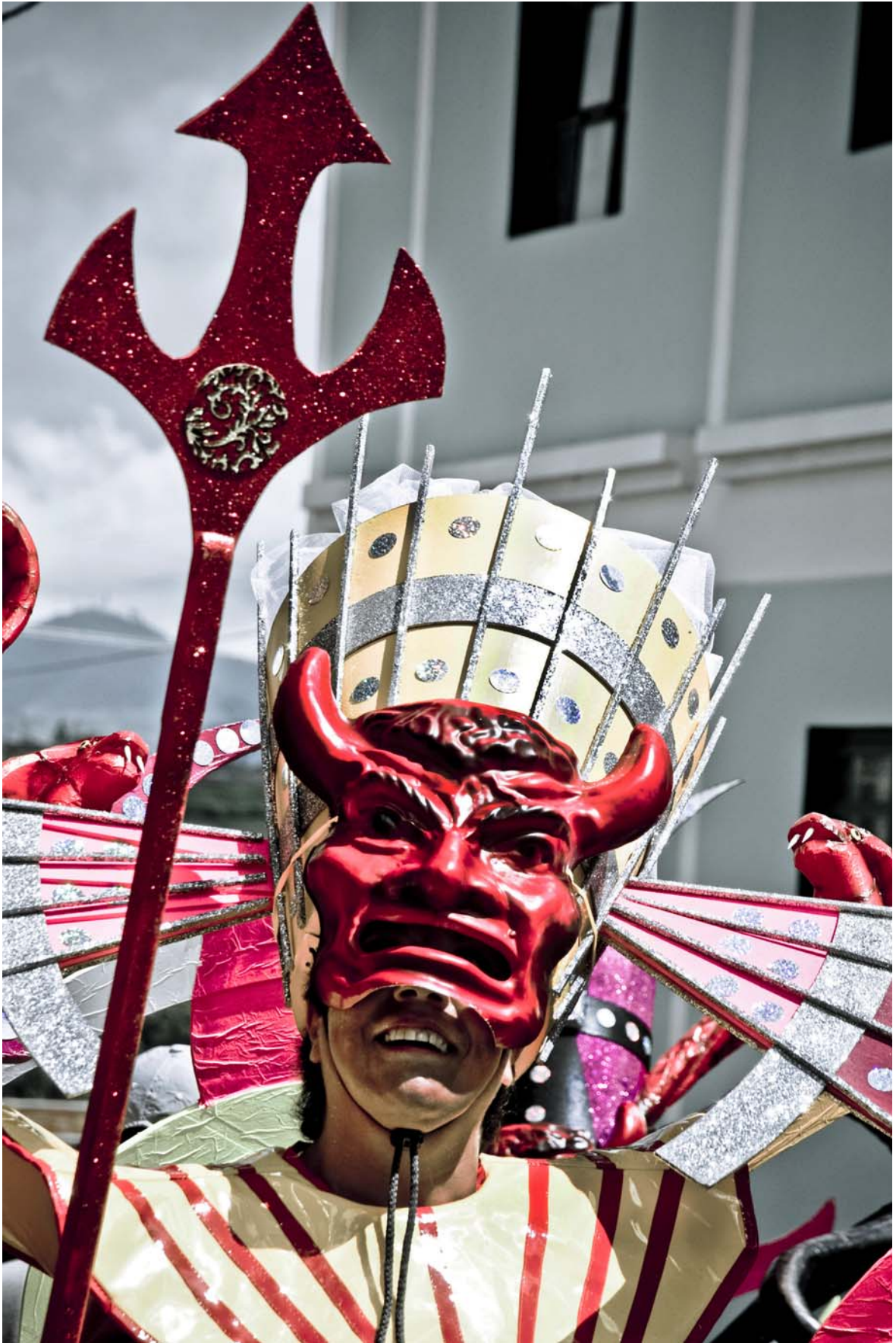
Diablo-cruz , Riosucio, Caldas, Colombia, 2011.