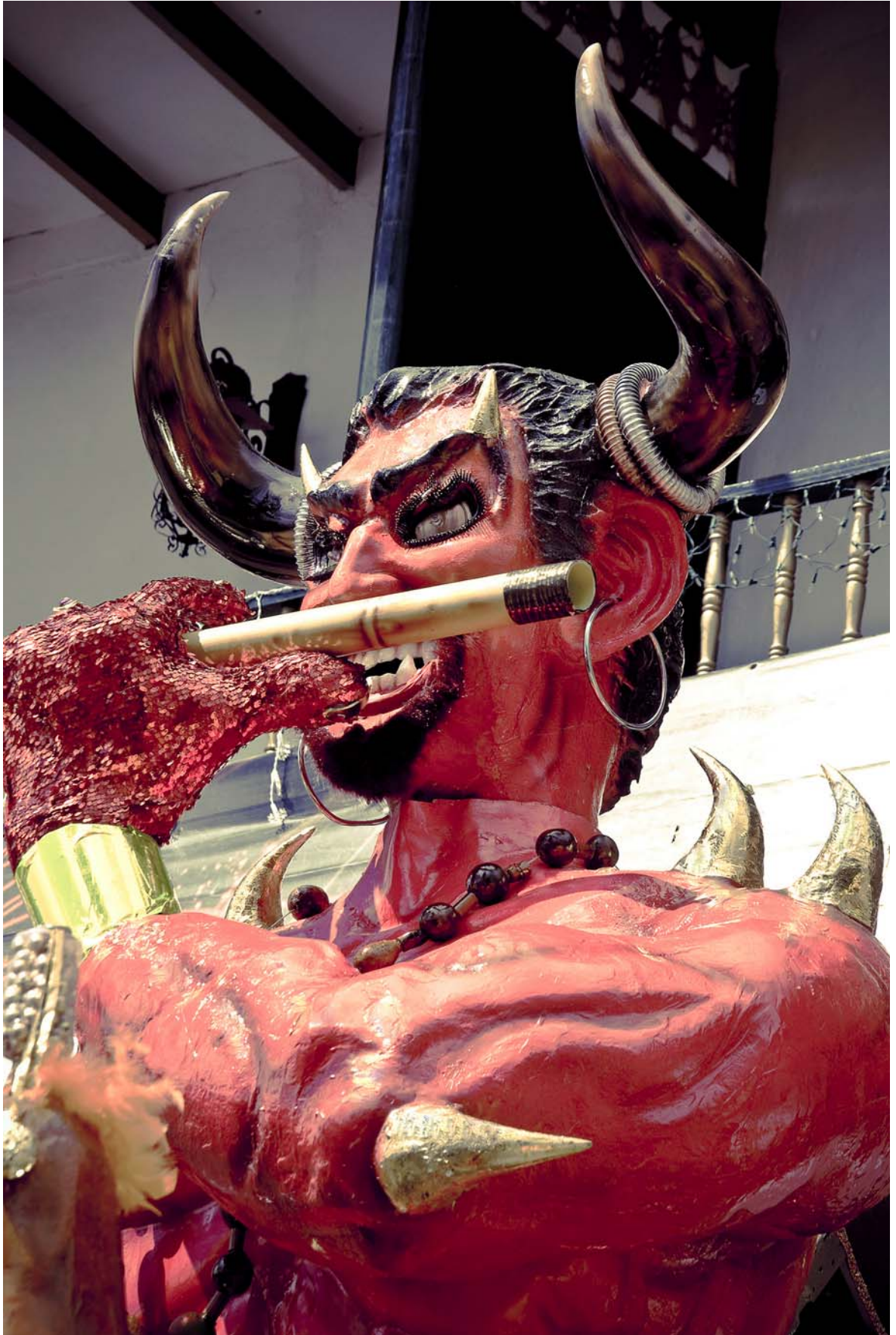
© Mauricio Montoya , Diablo-plaza , Riosucio, Caldas, Colombia, 2011.