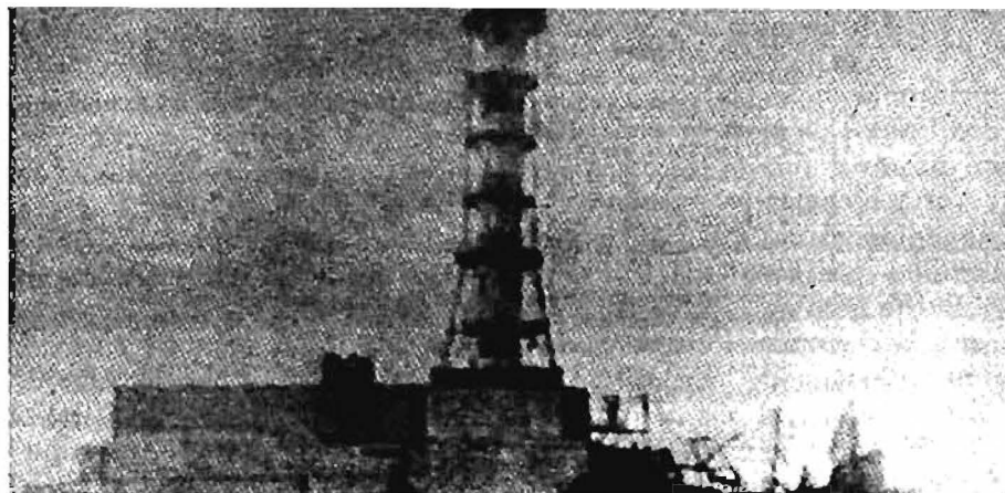
La planta Chernobyl. Imagen de la televisión soviética

El Ministerio de Energética y Electrificación de la URSS y la