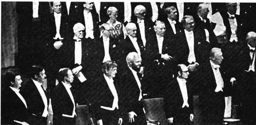
Aspecto de la ceremonia de la entrega del Premio Nobel en Estocolmo el 10 de diciembre de 1984. Del lado izquierdo se encuentran Carlo Rubbia y Simon Vander Meer, quienes obtuvieron el premio de física 1984 por su descubrimiento de las partículas W y Z. En la segunda fila se encuentran los Premio Nobel 1979 quienes predijeron teóricamente dichas partículas. A la izquierda de Abdus Salam están Sheldon Glashow y Steven Weinberg.

Deseo ahora regresar a Turquía y a las instituciones que pueden ser creadas y que necesitarán de físicos turcos. Del contacto personal que he tenido con ellos, sé que los físicos turcos son algunos de los más imaginativos de todo el mundo en desarrollo. Se involucran en forma consciente en problemas difíciles de física, y ésto es algo que yo respeto. Hace poco visité este país cuando tuve el honor de ser recibido por el presidente Kenan Evren. Le sugerí en ese entonces que lo que Turquía necesitaba en sus planes y prioridades nacionales era algo análogo a los laboratorios Bell Telephone que tienen los Estados Unidos de América en el área de las comunicaciones. Estos laboratorios han producido seis premios Nobel que han contribuido al desarrollo de la física básica, además de incluir en su lista de inventos a los transistores y otros desarrollos tecnológicos. Estimo que el análogo de estos laboratorios para Turquía, Egipto o Paquistán costaría 40 millones de dólares para construirlos y alrededor de 4 millones de dólares anuales para mantenerlos en operación. Considero que pueden crearse con el nivel más alto de calidad y que es posible encontrar a los que los crearían en Turquía. ¿Habrá una esperanza de que este proyecto y otros similares en ciencia fueran una realidad en el mundo en vías de desarrollo?