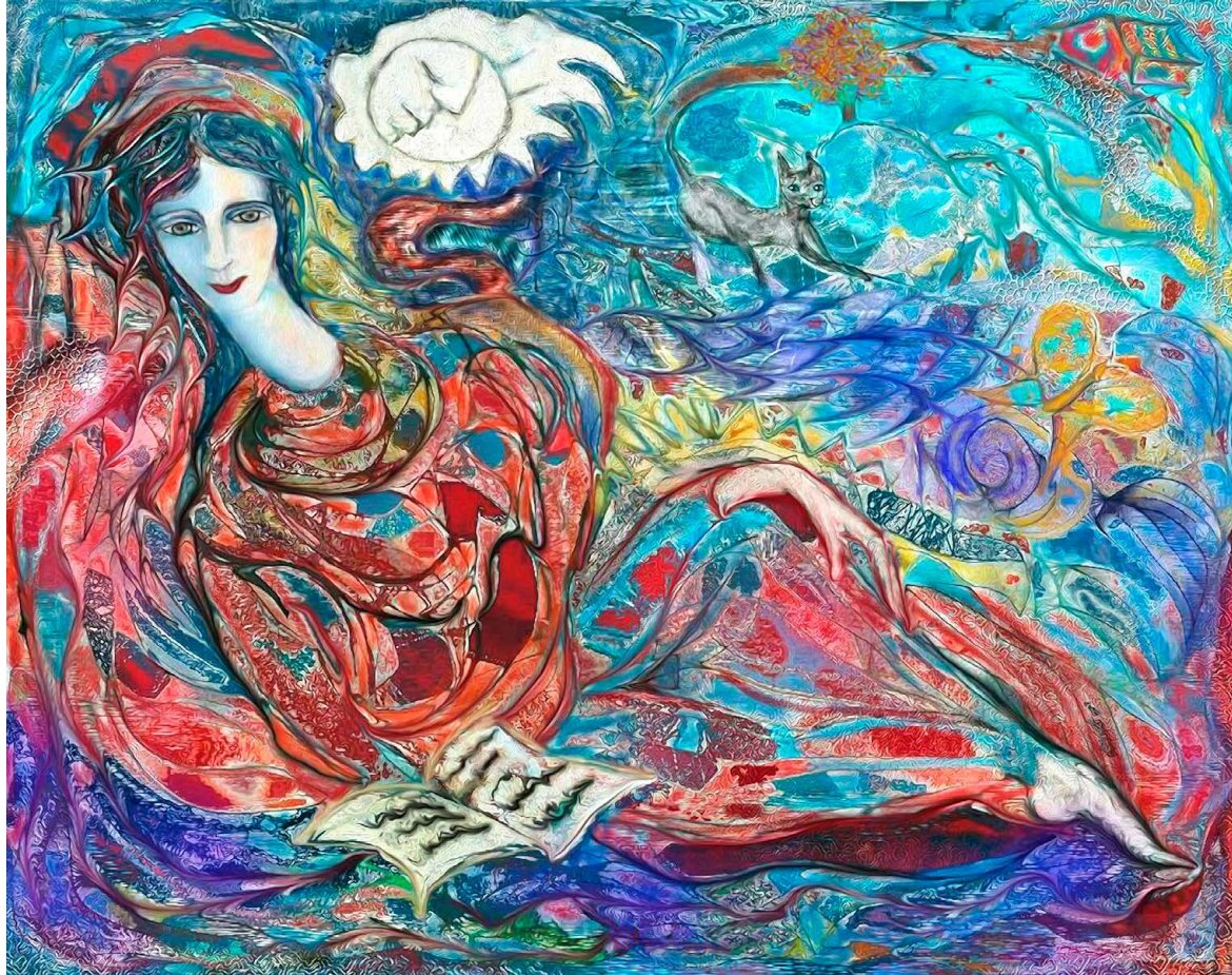
© Malú Méndez Lavielle. Gitana .